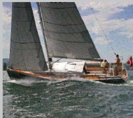
Schicke Dänin: Olsen 370