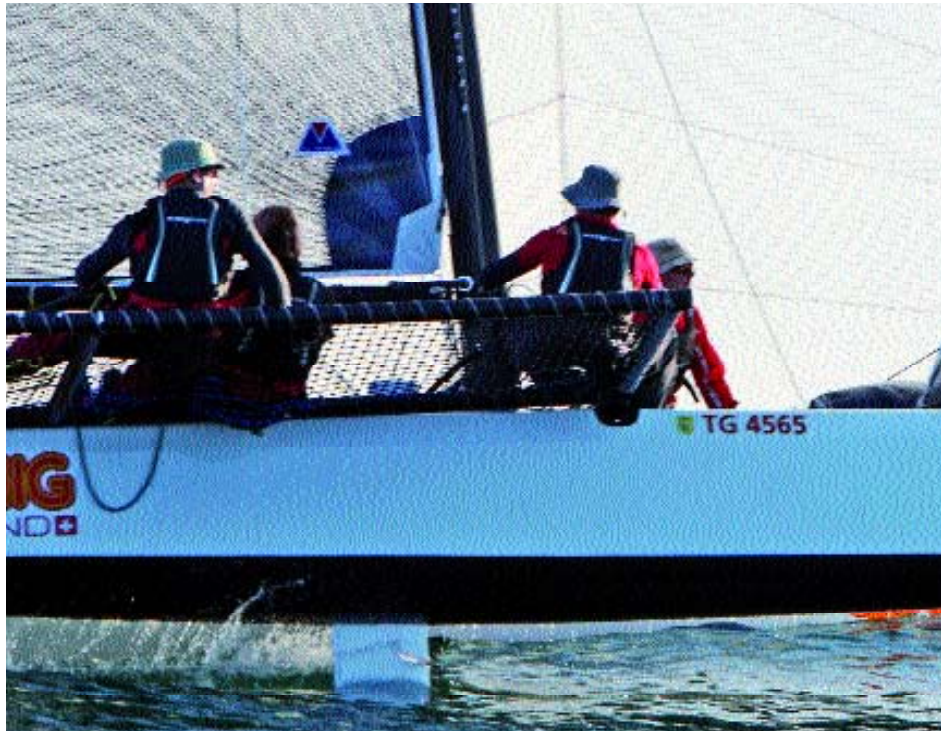
„Sonnenkönig“ heißt der Sieger der diesjährigen Rund Um.