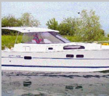
Kleinkreuzer aus Polen: Maxus 24