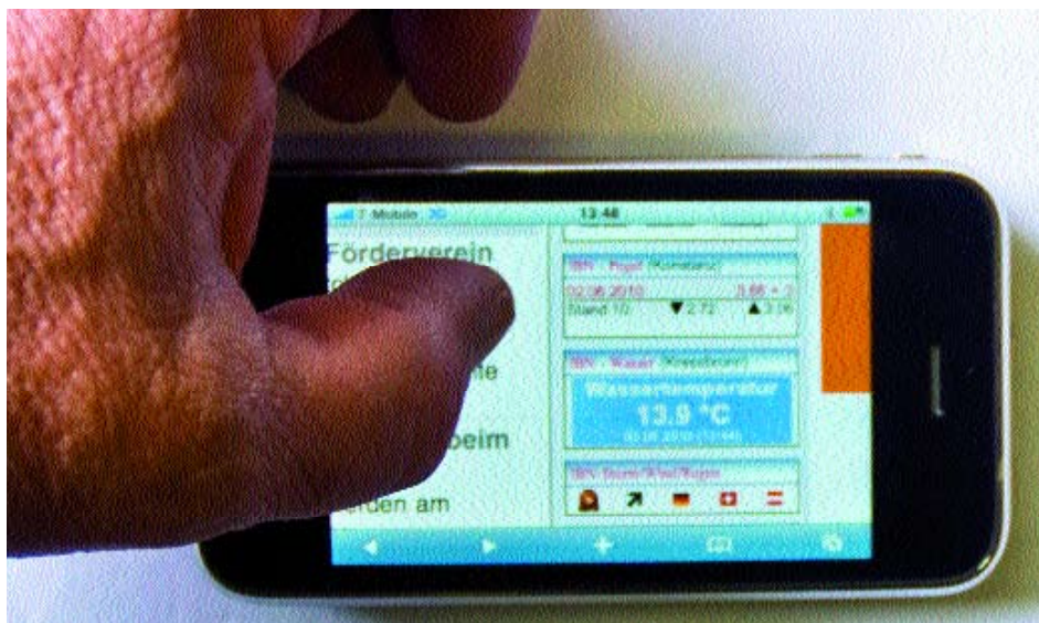
Moderne Kommunikationselektronik kann auch auf dem Boot sinnvoll eingesetzt werden. Wie's geht und welche Möglichkeiten die neue Technik bietet, steht ab Seite 10.