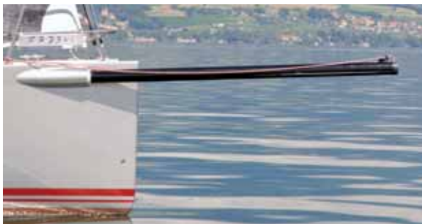
Rüsseltier: Der Carbon-Gennakerbaum ist fast zweieinhalb Meter lang. Halsen wird damit zum Kinderspiel. Clever: Die Leine unter Deck zum Ausfahren läuft im Handlauf.