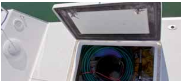
Stauraum für Fender und Leinen sowie Badeleiter.