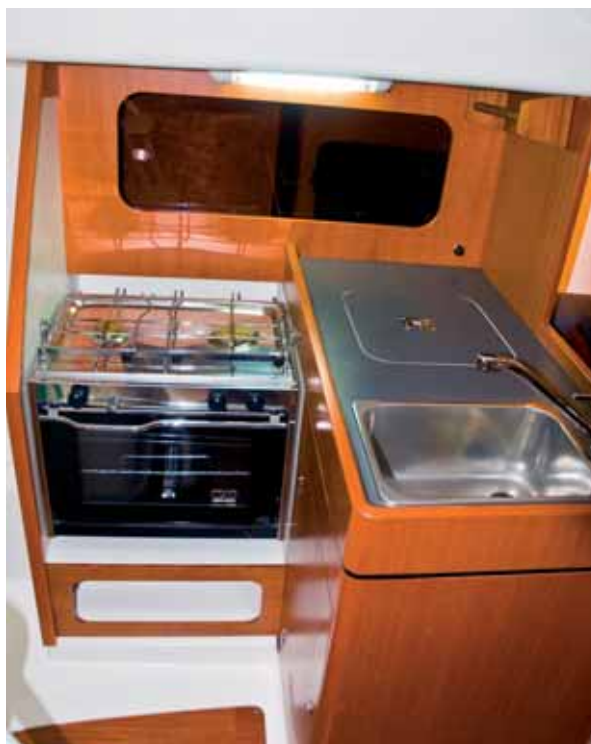
Sportlich, mit vollwertiger Pantry.