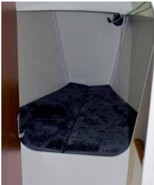
Eine brauchbare Doppelkoje bietet das Vorschiff. Der Stauraum ist knapp, und manchen stört vielleicht der Rüssel.