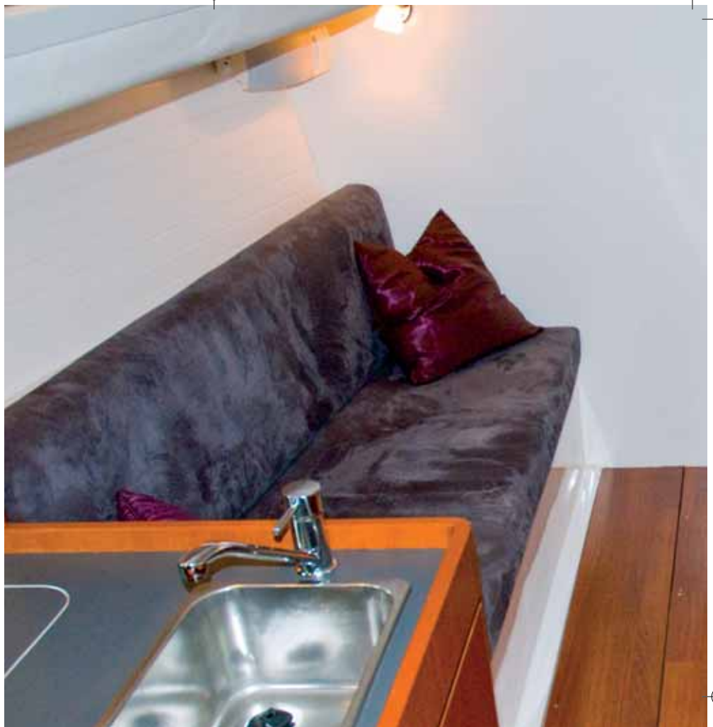
Der Wohnkomfort der J111 ist nicht üppig. Segelspaß steht bei dem Boot im Vordergrund, erst dann kommt alles andere.