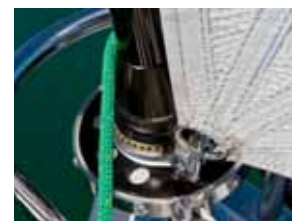
Carbon-Vorstag und flache Trommel.

Altbewährtes kommt wieder: Barber mit Ringführung, um die Genuaschot innenbords zu schoten. Bedienung über eine Talje auf dem Kajütdach.