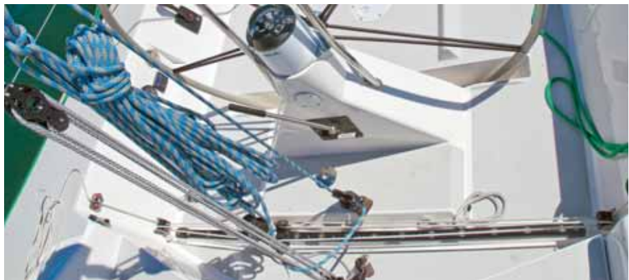
Die Steuerzentrale. Traveller, Großschot und Pumpe sowie Ventil für das Achterstag sind vor dem Ruder.