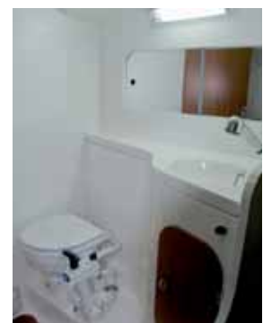
Einfache Nasszelle, zum Vorschiff ist sie offen.