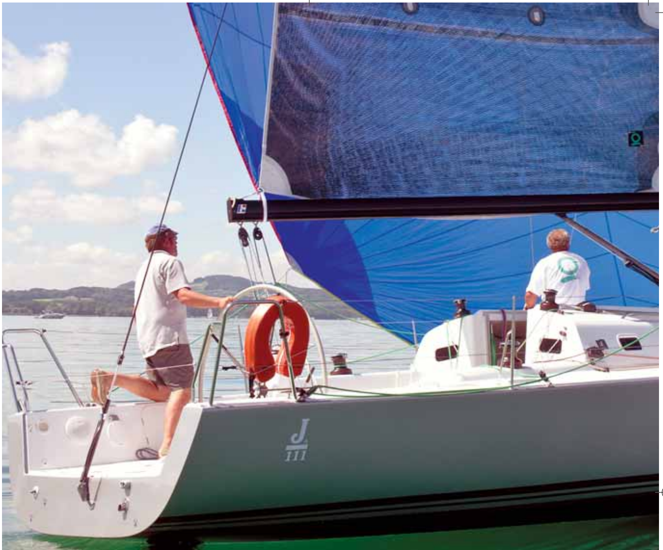
Eine Riesen-Blase mit 160 qm treibt die J 111 bei Leichtwind flott voran.