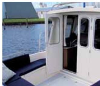
Nach achtern offen – die dreitei-lige Cockpittür.