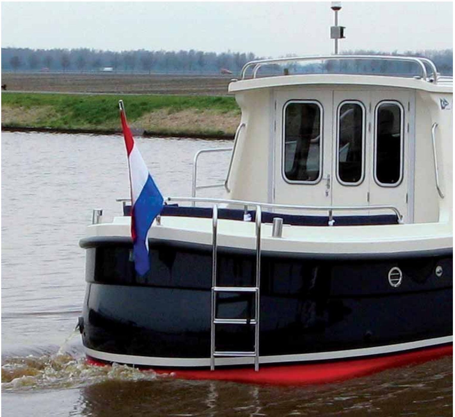
Elegantes, knuffiges Fahrtenboot mit ausgezeichneten Fahreigenschaften, dem man beim ersten Hinsehen nicht unbedingt ansieht, dass es für die CE-Kateg