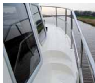
Breite und sichere Gangbords.

Egal, ob volle Kanne rein in die Kurve oder sensibel manövriert, nach vier Ruderumdrehungen von Anschlag zu Anschlag ist ein Vollkreis durchgezogen, der sich bei niedrigster Drehzahl von 850 U/min zwischen einer und eineinhalb Bootslängen darstellt, unter Volllast mit einer zusätzlichen Länge veranschlagt werden muss. Auch dabei ist der Rumpf weit entfernt, den ihm vorgegebenen Kurs zu verlassen,