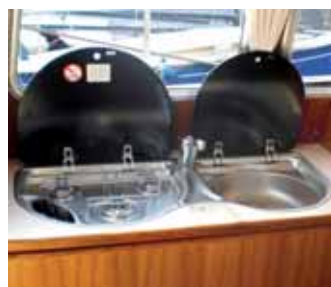
Pantry mit Spüle und Kocher.

optional auch als Dusche ge-nutzt werden kann. Gegen-über unter dem Steuerstand an Backbord ist ein Kleider-schrank. Der Steuerstand selbst ist übersichtlich konzi-piert und ergonomisch ein-