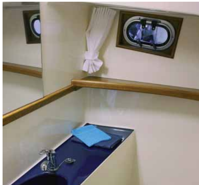
Schnörkelloser und gut zu reinigender Toilettenraum.

den beiden vorangegangenen Exponaten – ist das Vorschiff unter Deck in offener Variante konzipiert. Die Werft will jedoch auch dem Wunsch nach einer geschlossenen Kabine gerecht wer-