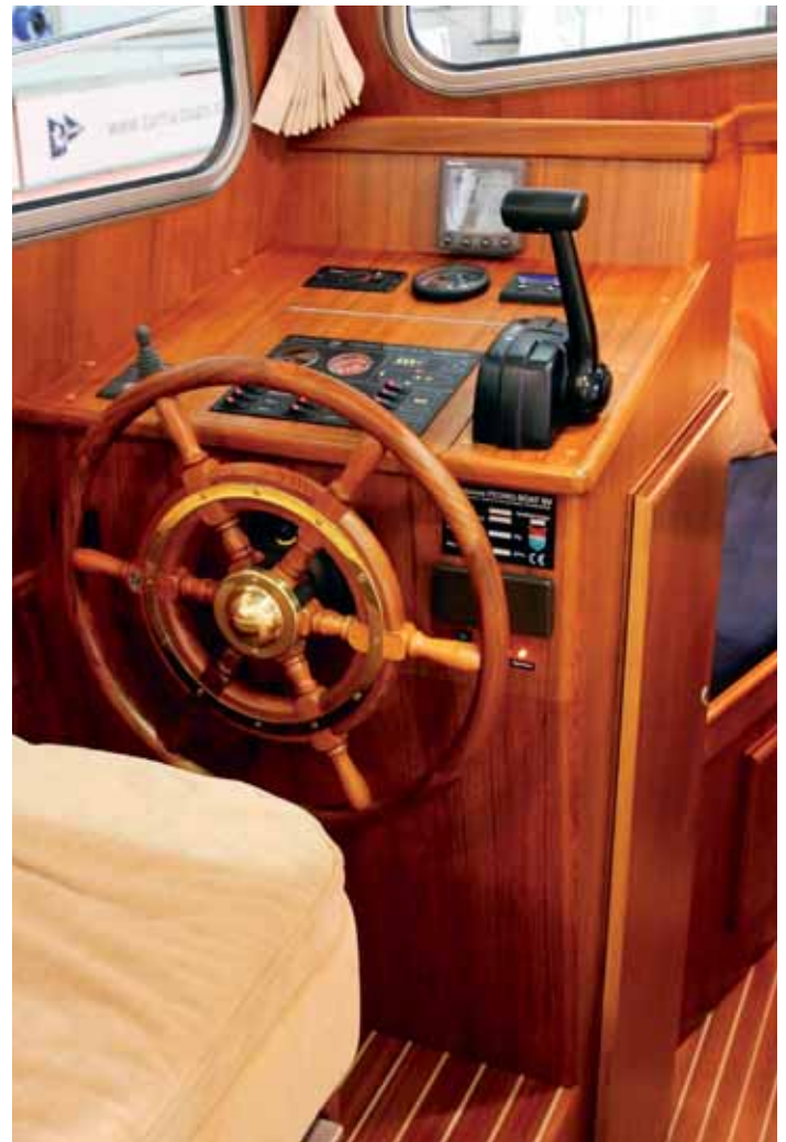
Steuerstand mit klassischem Holzrad und übersichtlicher Instrumentierung.