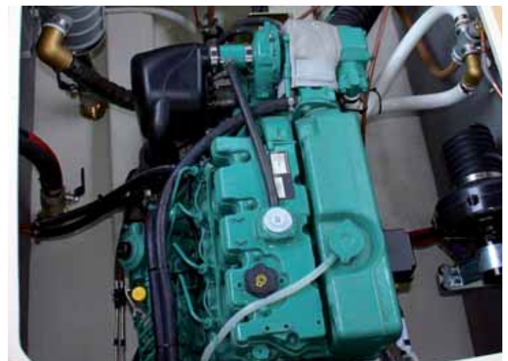
Bestens vom Cockpit aus zugänglicher Motorraum.

, außerhalb von Küstengewässern, zertifiziert ist.