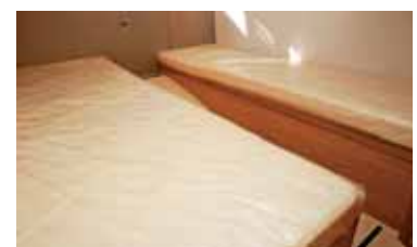
Das Doppelbett in der Gästekabine kann mit einem Handgriff geteilt werden.