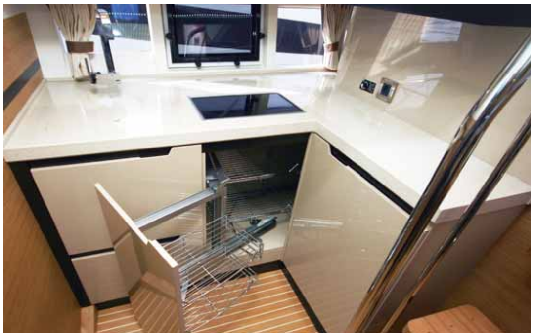
Perfekt eingepasst ist die Pantry, die wie zu Hause mit allem Drum und Dran ausgerüstet ist.