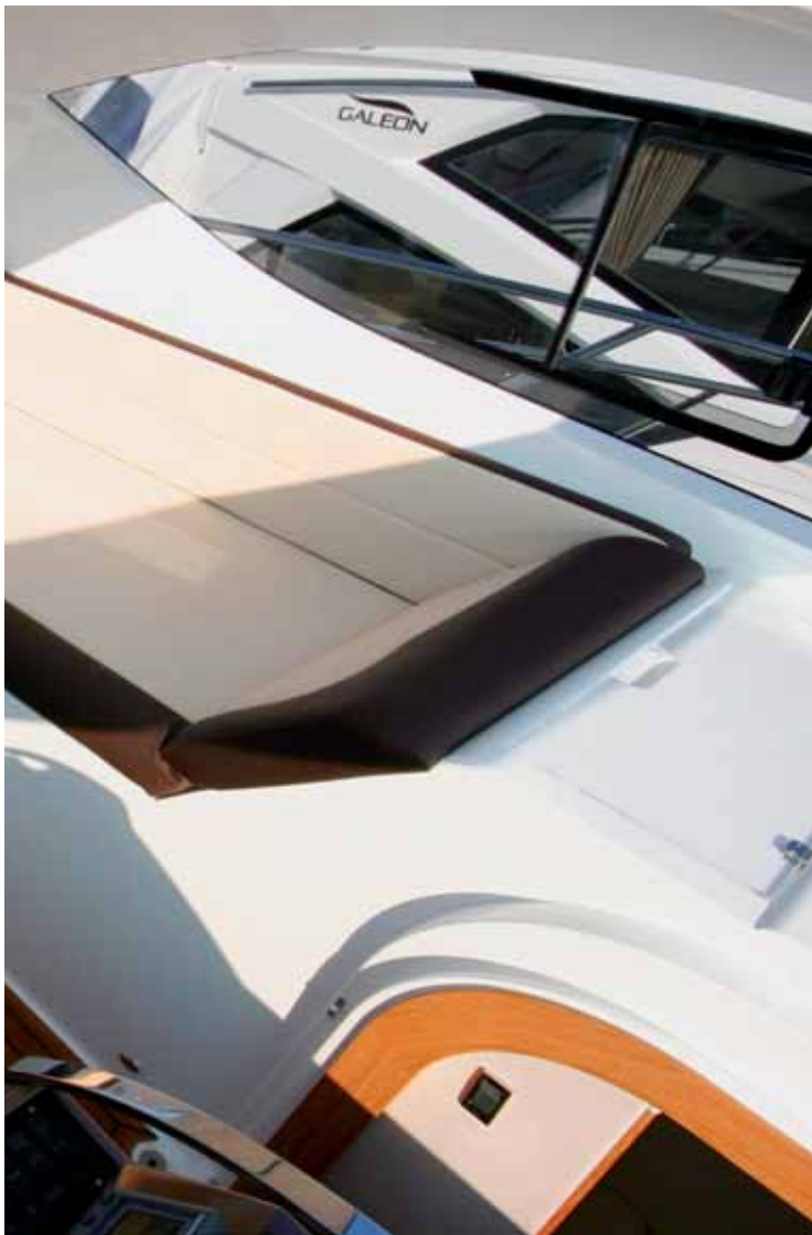
ge in Höhe des Fahrerstandes gegenüber dem Rudergänger.