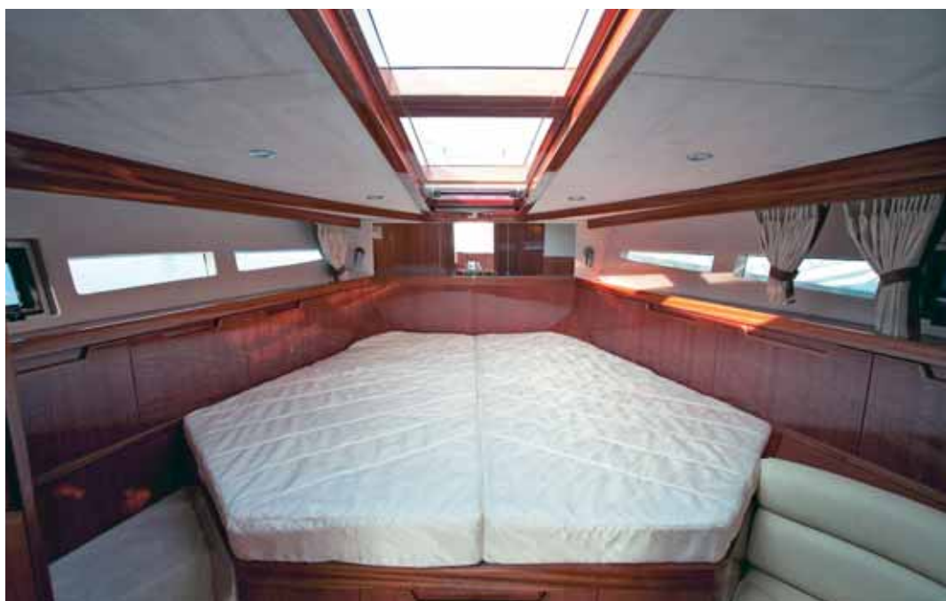
Das Reich des Eigners im Vorschiff mit großer frei stehender Doppelkoje, viel Stauraum und Dusche mit Toilette.

Hier über Manöviereigenschaften zu philosophieren, kann vernachlässigt werden, denn was soll das Boot ande-