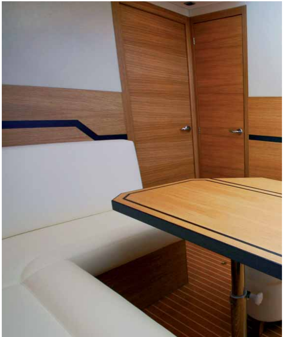
Der Salon wirkt modern und geradlinig und das Eichenholz wird stilvoller eingesetzt.

Und dabei schlug sich die 385 prächtig. Lediglich acht bis zehn Sekunden mit abgesenkten Trimmklappen notieren wir, um die Verdrängerphase zu überwinden. Dabei streckt das Vorschiff nur kurzfristig die Nase etwas in die Höhe, ohne die Sicht voraus wirklich zu behindern. Gefühlvoll mit der elektronischen Schaltung