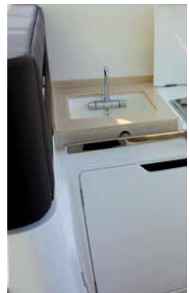
Die Wetbar mit Elektrogrill hinter dem