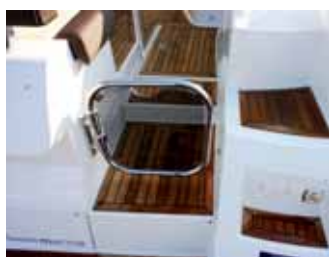
Durchgang auf die Badeplattform.