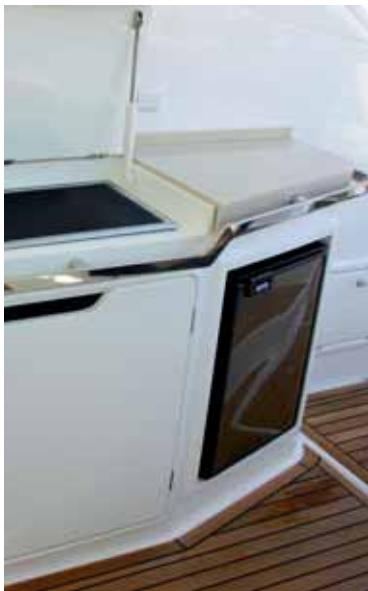
nd an Steuerbord.

Und schließlich das Vorschiff, des Eigners Reich: Breites Doppelbett, taghell von oben durch längliche Lichtluken, mit Jalousien verschließbar gegen neugierige Blicke. Sideboards und Schränke bieten auch hier jede Menge Stauraum. Das separate Badezimmer mit elektrischer Toilette rundet diesen Schiffsbereich ab.