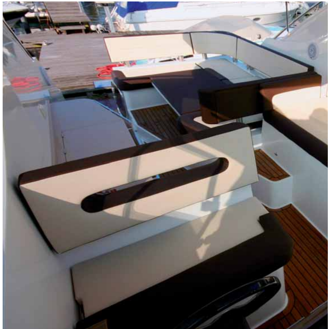
Der achterliche Cockpitbereich mit klappbarem Tisch, Schlafplatz unter freiem Himmel bei abgesenktem Tisch und e

Die Bestückung des Dashboards fällt üppig aus. Jederzeit unter Kontrolle sind Motorendrehzahl, Kühlwassertemperatur, Batterieladung, Kraftstoff- und Wassertank,