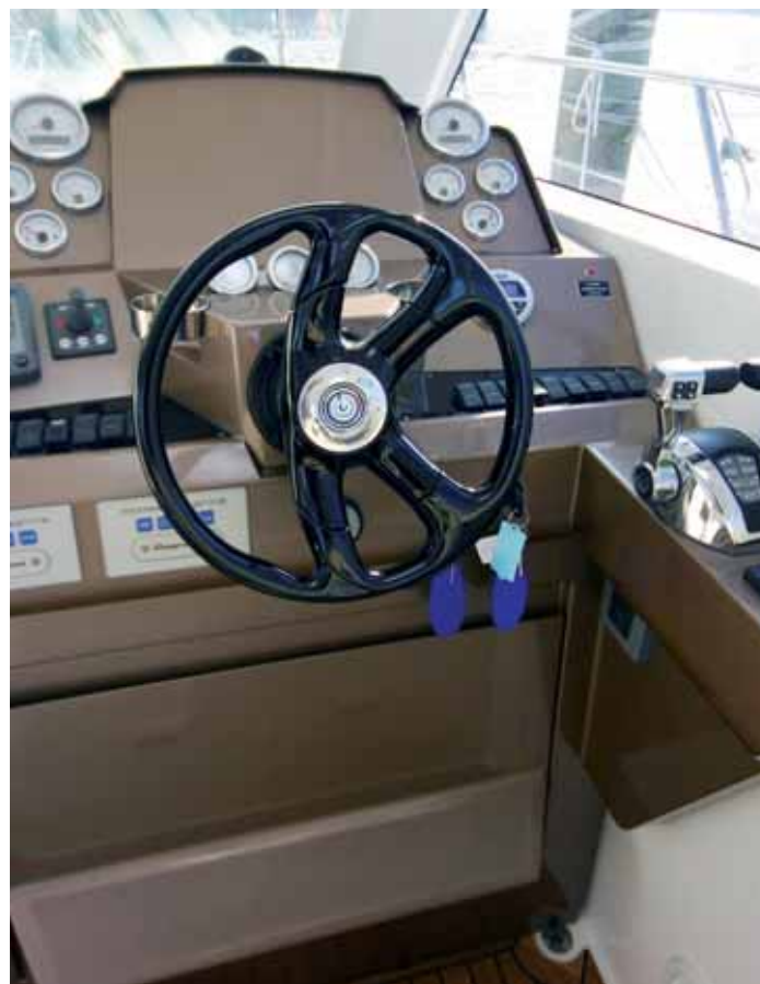
Übersichtlich und ergonomisch trotz vieler Schalter zum Spielen.