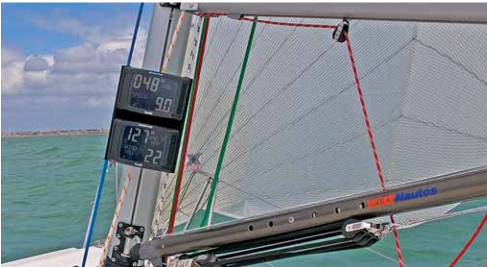
Gute Segeleigenschaften und schnelles Anspringen zeichnen die J 97 aus.