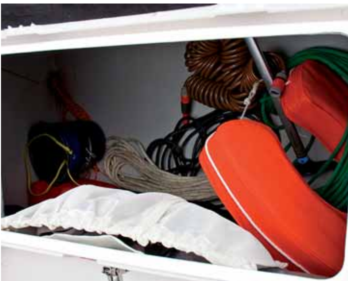
Große Backskiste Achtern an Steuerbord: Sie fasst alles.