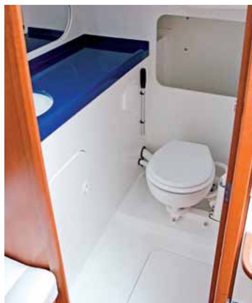
Pantry mit Ölzeugschrank.