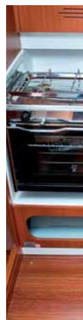
Pantry mit Herd