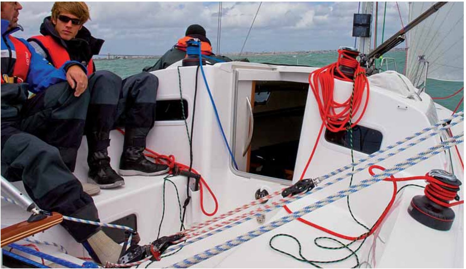
Ein bequemes Cockpit fürs Fahrten- und Regattasegeln.