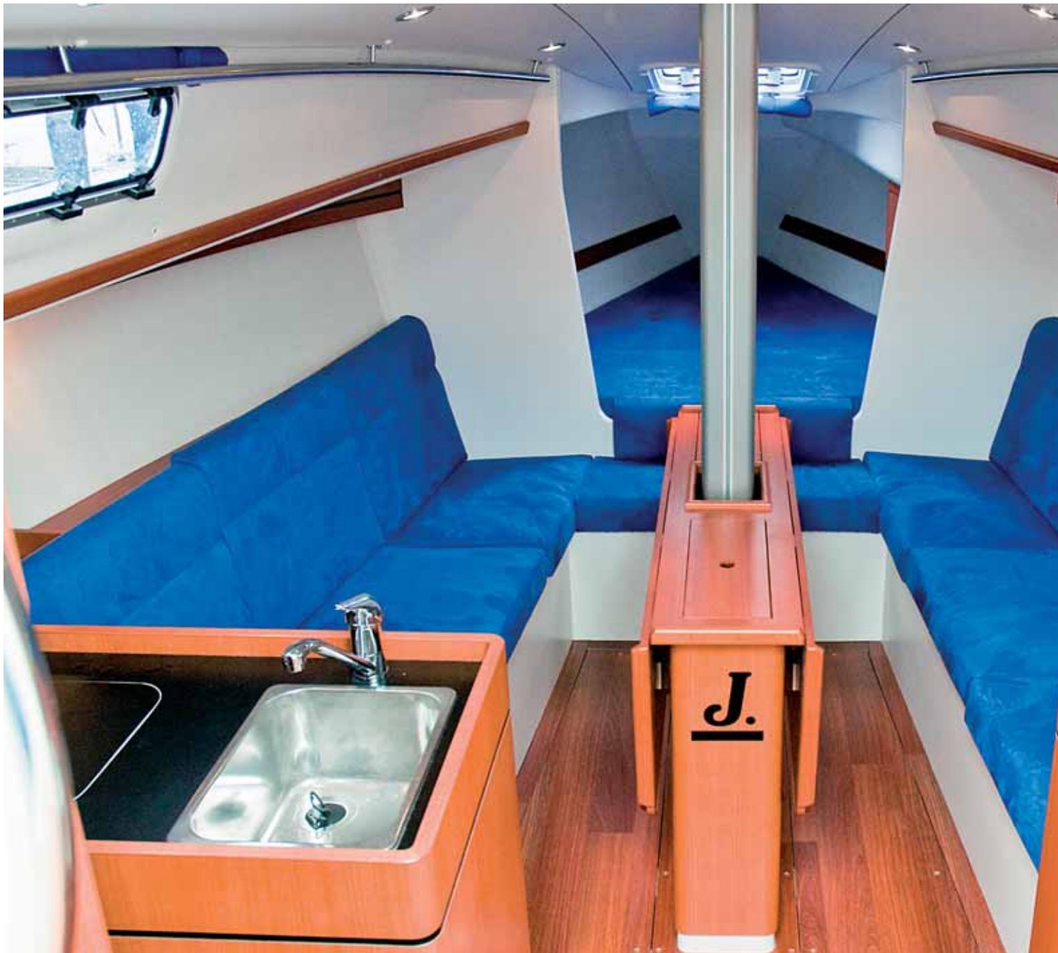
Hell, freundlich und großzügig präsentiert sich der Salon der J 97.