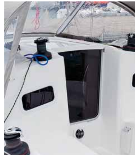
Leinensäcke halten das Cockpit aufräumt.