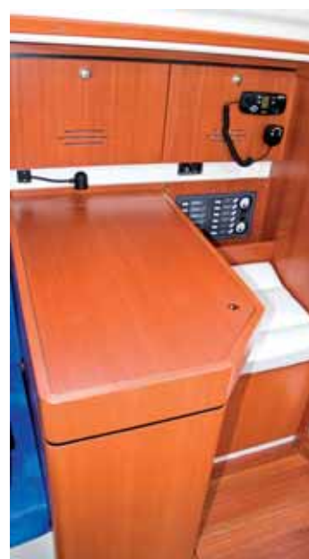
Praktisch: die Navigation.