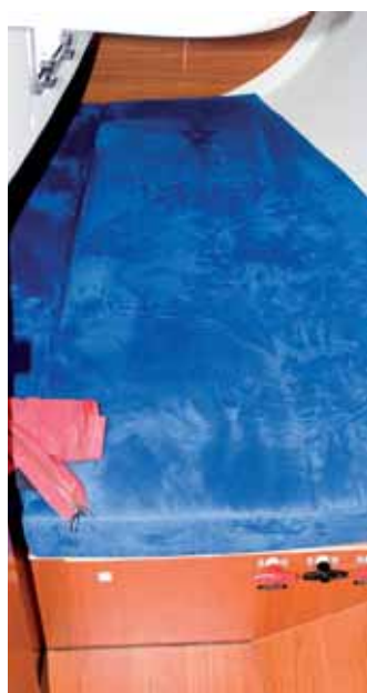
Koje in der Achterkabine.