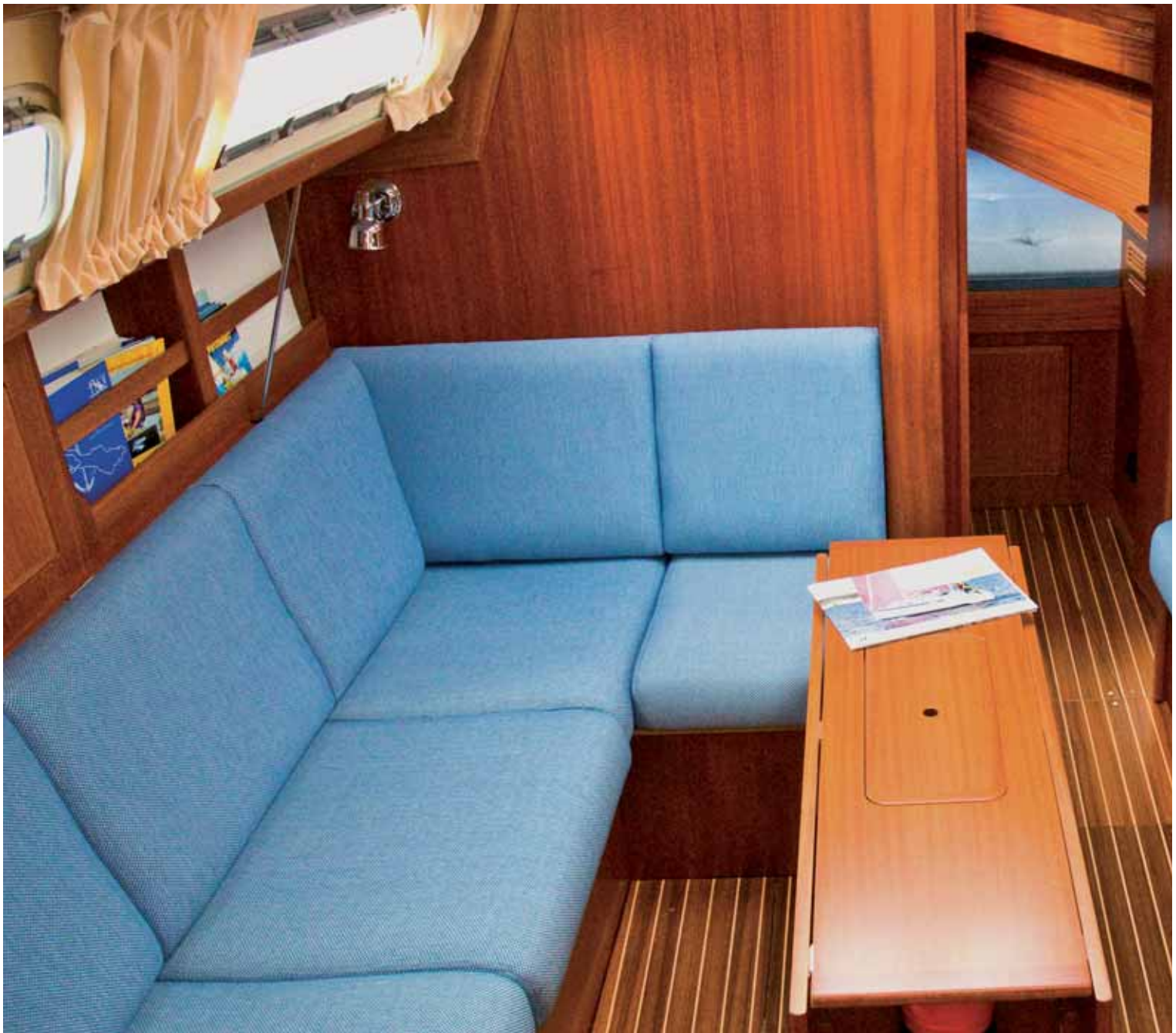
Der Salon der HR 310 ist für das kompakte Boot groß. Die Werft verarbeitet viel Holz in traditioneller Verarbeitung.