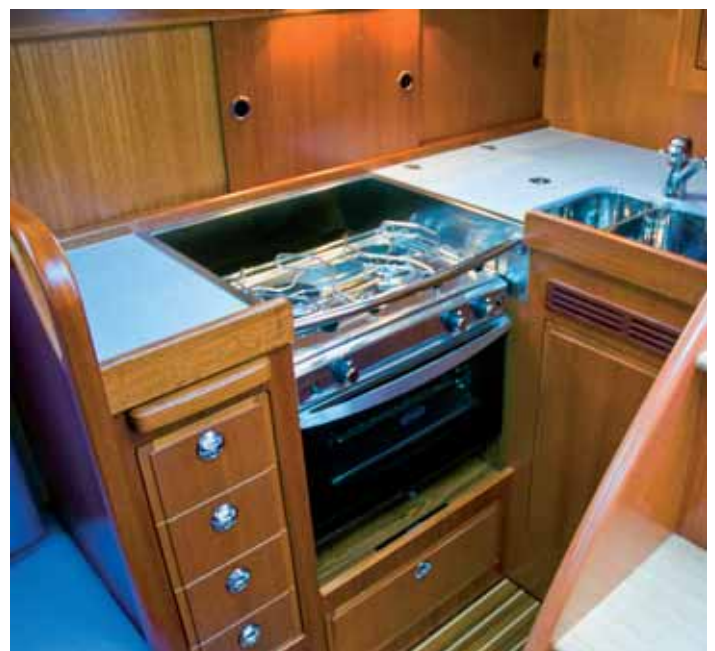
Die Pantry ist zur Raumoptimierung nach Achtern gerückt.