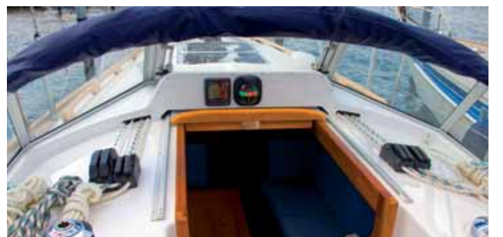
Die feste Scheibe mit Sprayhood gehört zur Hallberg-Rassy.