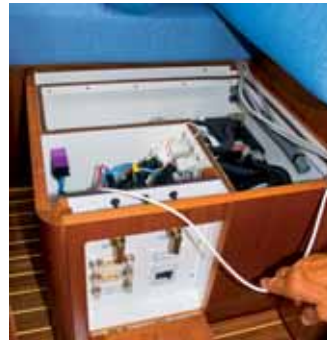
Die Batterien im Salon.