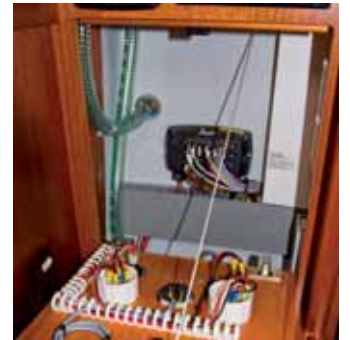
Bustechnik für die Elektrik.