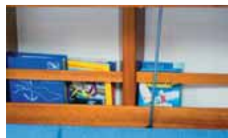
Schapp mit Stegen und Wegerung.