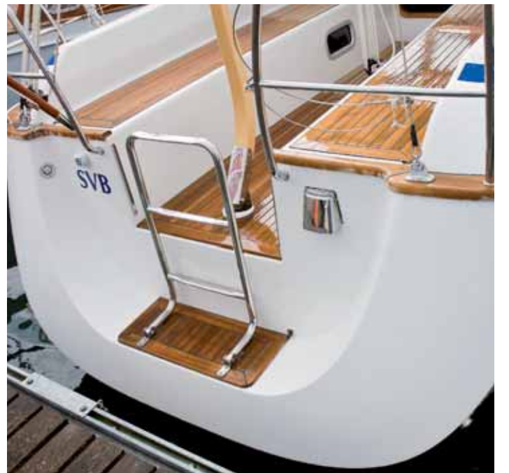
Heck mit modernem U-Spant.