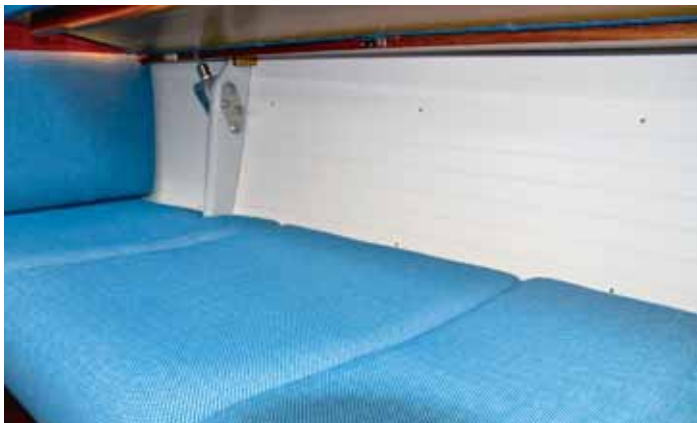
Breite Kojen im Salon. Die Rückenlehne der Längskoje ist hochgeklappt.