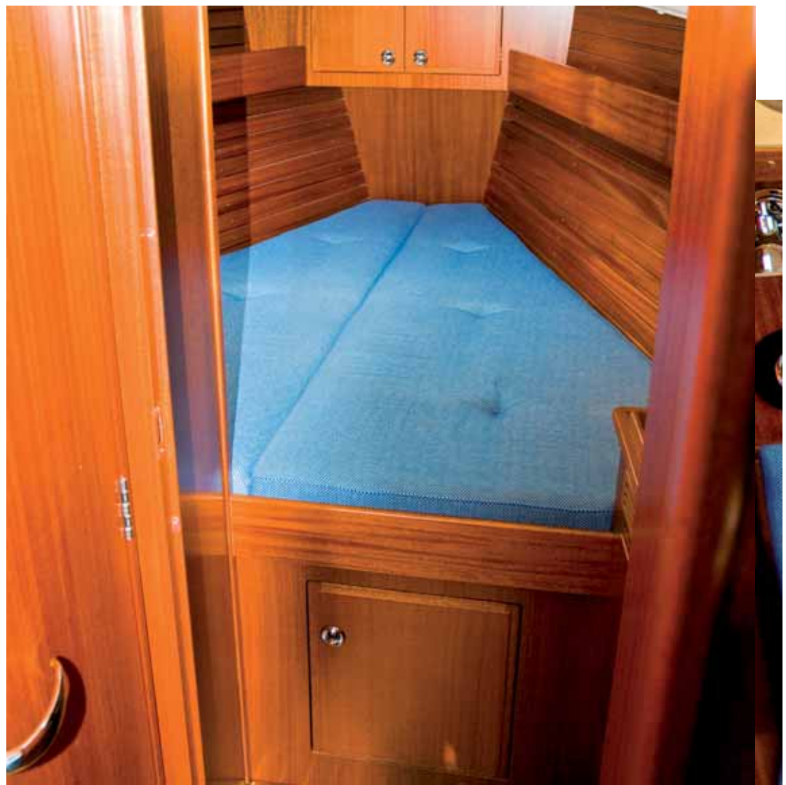
Vorschiffskabine mit breiter Koje und viel Stauraum.

gelingt es einen geräumigen Salon mit einem großen, ab- klappbaren Tisch zu realisie- ren. Die beiden Längskojen kann man Rassy typisch zu- dem durch Hochklappen der Rückenlehnen in zwei breite und lange Kojen verwand- eln, sodass die HR 310 ins- gesamt sechs Schlafplätze bietet. Die Stehhöhe im Sa- lon beträgt 1,85 Meter, im Schnitt liegt sie im gesamten Boot über 1,84 Meter. Groß bemessen sind auch die Ko- jen, die im Vorschiff 206 cm mal 176 cm und in der Ach- terkabine 206 cm mal 143 cm messen. Die Kojenbretter haben Löcher, sodass die Matratzen belüftet werden.