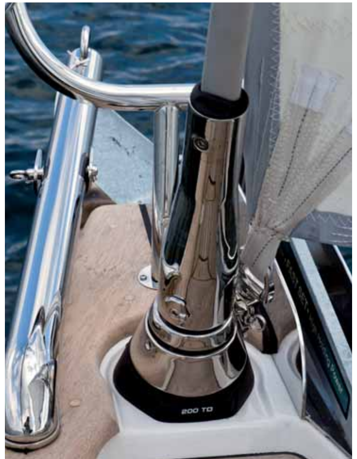
Moderne Rollfockanlage unter Deck.

Die Segelfläche ist ausreichend, aber nicht üppig für ein Leichtwindrevier. Sie verteilt sich auf ein Großsegel mit 25,5 qm und eine Rollgenua mit 21,7 qm. Ein größeres Vorsegel geht nicht wegen der langen Salinge. Für Leichtwindtörns bietet Hallberg-Rassy einen Gennaker an, der an einem Galgen gesetzt wird. Er muss zusätzlich geordert werden, ist aber für den Bodensee zu empfehlen, zumal so ein Segel fast so einfach wie eine