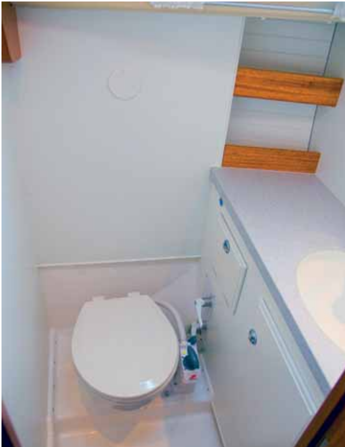
Schnörkellos und einfach zu reinigen: die Nasszelle.