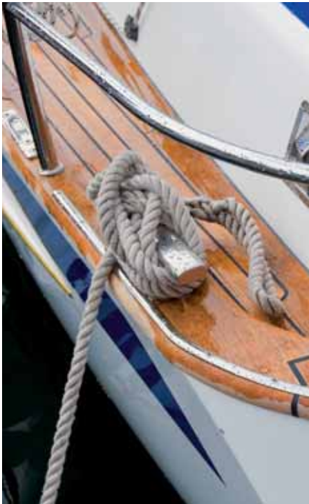
Solide Beschläge, geschütztes Schanddeck.

doch etwas aus: um die 5,5 Knoten messen wir, zum Teil weniger. Da merkt man, dass dem Segel oben die Überwindung fehlt, die natürlich Power bringt. Mehr Speed kann dann bei bestimmten Kursen der Gennaker bringen.