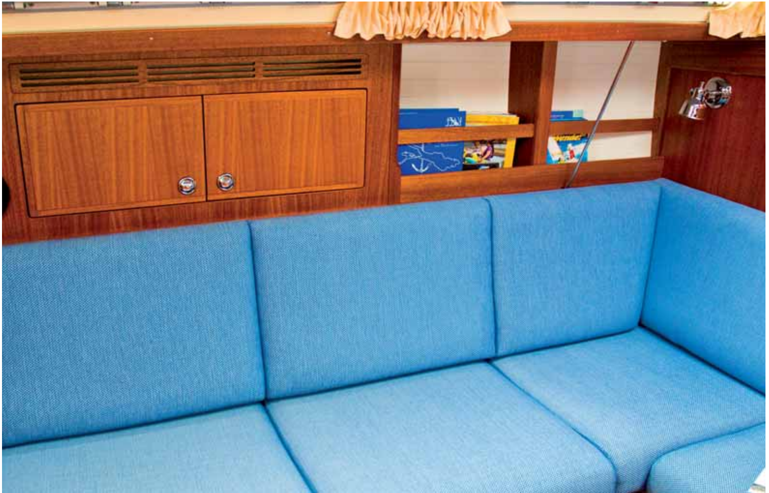
Gemütliche Sitzecke. Der Platz unter Deck reicht für bis zu sechs Personen.