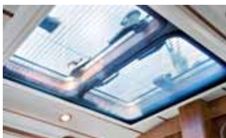
Skylight mit Holzrahmen und Rollo.