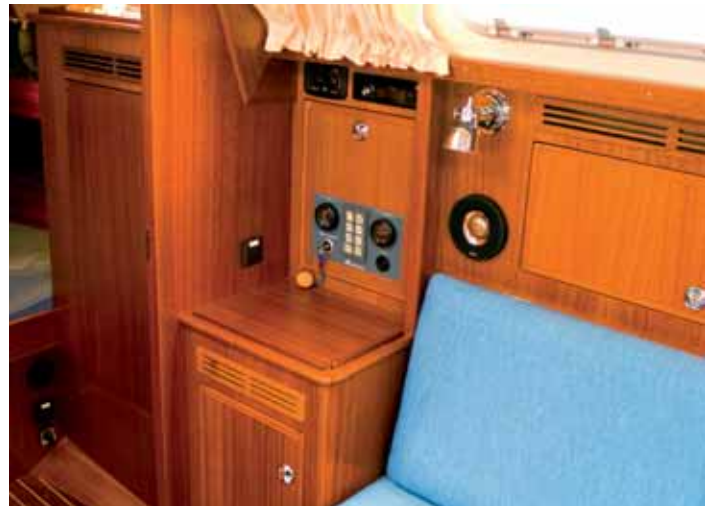
Rudimentär: die „Navigationsecke“.