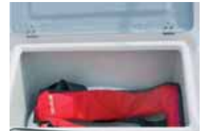
Gut konstruierte Backskisten, etwas lasche Scharnierbefestigung.

PS-Motorisierung an. Der Motor stammt im Angebotspaket üblicherweise von Selva Marine. Jede Motorisierung anderer Hersteller ist auf Kundenwunsch im Rahmen des Erlaubten ebenfalls möglich. Die Fahrleis-