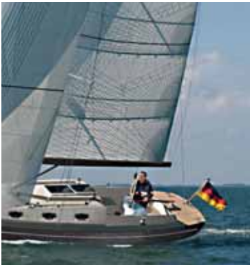
seiner Leertrocknungswicht von 2600 kg ist die Clarc 33 trailerbar.

Segler mit tiefen Plätzen können mit einem Festkiel