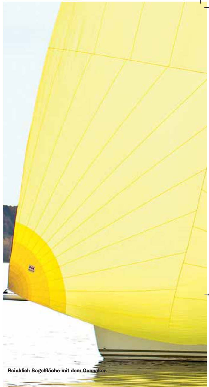
Reichlich Segelfläche mit dem Gennaker.

Doch auch so läuft das rund fünf Tonnen schwere Boot bei