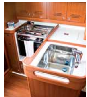
Pantry: alles da, was man braucht.