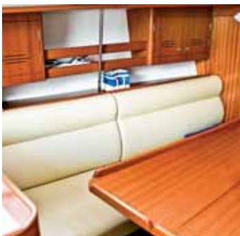
Innenausbau in Holz.

Ultramarin , Im Wassersportzentrum 10, D-88079 Kressbronn, Telefon +49 (0) 75 43/ 96 60-0, www.ultramarin.com