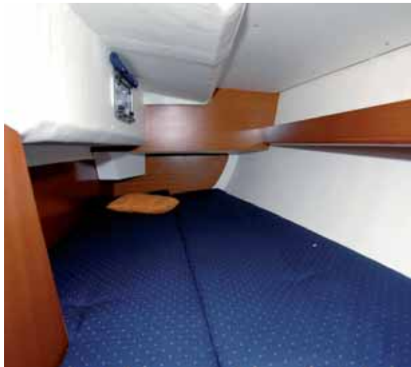
Die Achterkabine ist geräumig, die Koje groß.