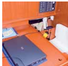
Die Navigation mit viel Platz.