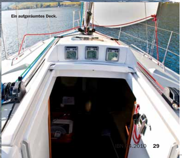
Ein aufgeräumtes Deck.