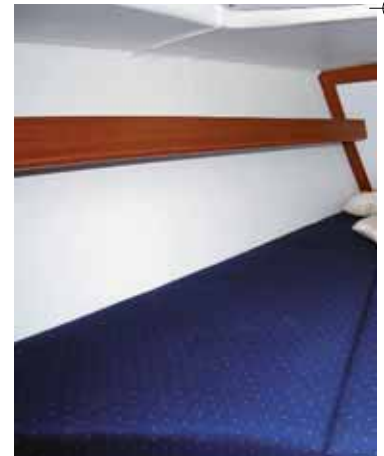
Vorschiffkabine mit Gennakerbaum.