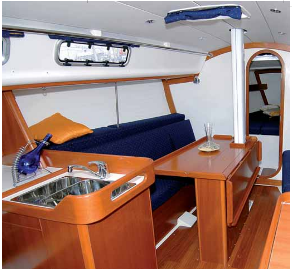
Der Salon hier mit weißen Schotwänden.

Die per Leine verstellbaren Genuaschlitten sind kugelgelagert. Das Deck ist erfreulich aufgeräumt und frei von Beschlägen. Es wird gestrichen und ist sehr rutschfest. Alternative Farben zu Weiß kosten allerdings Aufpreis. Stauraum an Deck gibt es im Ankerkasten sowie in einer großen und tiefen Backskiste an Steuerbord, die auch von der Nasszelle zugänglich ist. Das Heck ist offen, die Badeleiter kann eingehängt oder verstaut werden. Eine Ausrüstungsalternative ist eine demontierbare Backskiste, die das Heck verschließt.