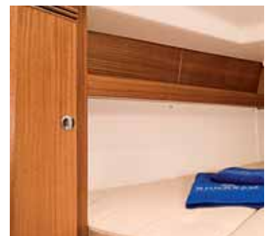
Die Kojen sind auch im Vorschiff ausreichend groß.