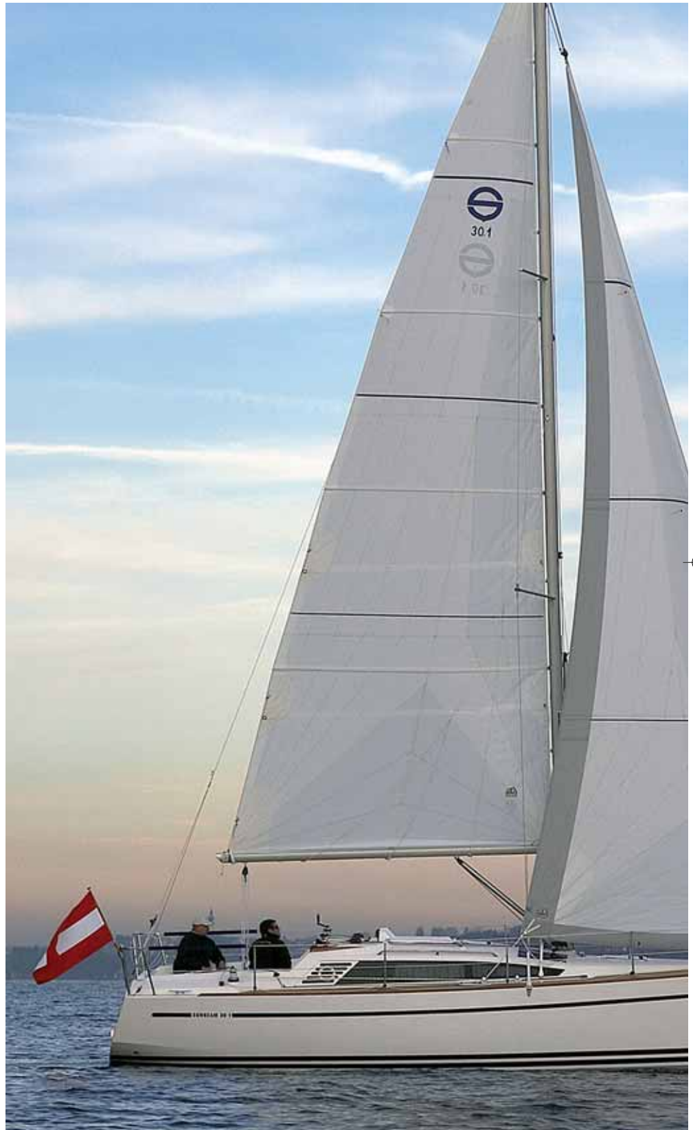
Die Hochbordigkeit bringt Stehhöhe und wurde geschickt kaschiert.

Von der außerdem noch angebotenen sehr viel älteren, geringfügig kürzeren, aber viel schmaleren Sunbeam 29.1, sticht die neue 30.1 allein im Aussehen erhellend ab.