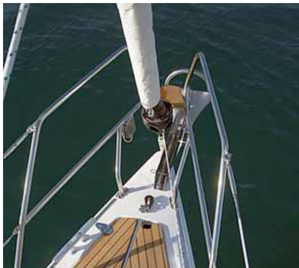
Rollsegel gehören zum Standard.

Da ist sie viel eher mit dem Flaggschiff der Werft, der 53er, die den Reigen der neuen Linie eröffnete, und der 34er zu vergleichen. Die neue 30.1 verfolgt am konsequentesten das neue Aussehen: Beide, auch die 34er, stammen aus der Feder des Laboer Designers Georg Nissen.