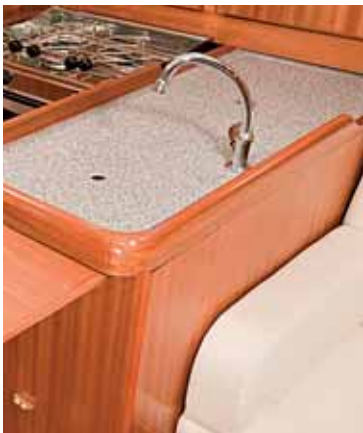
gibt es reichlich Stauraum.

Die neue Sunbeam 30.1 ist eine markante Erscheinung mit reichlich Platz, gutem Fahrtenkomfort bei einfacher Bedienung und solider Bauweise. Der im Vergleich zu den Mitbewerbern höhere Anschaffungspreis rechtfertigt sich durch die reichhaltige Standardausrüstung. Wer kein Massenprodukt sucht, ist gut bedient.