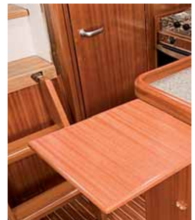
In der Pantry und überall sonst im Boot gibt es viel Platz.