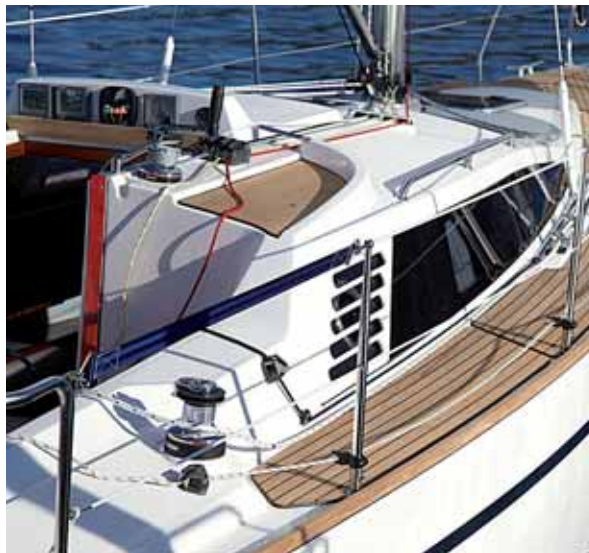
Einhandtauglich ist sie ebenfalls.