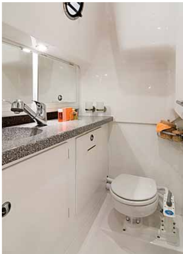
Für ein Boot dieser Klasse ist die Nasszelle sehr groß.