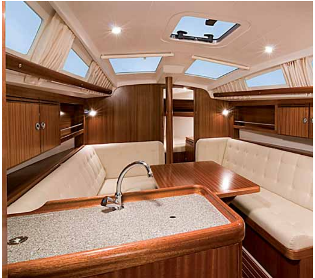
Guter Innenausbau und reichlich Stehhöhe.

„Luxury“ klingt nach teuer! Vergleicht man den Grundpreis mit dem der Mitbewerber, ist es die Österreicherin auf den ersten Blick auch. Dieser oberflächliche Vergleich greift bei der Sunbeam 30.1 aber zu kurz.