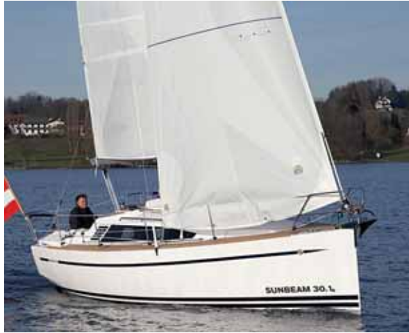
Die Sunbeam 30.1 macht von allen Seiten eine gute Figur.