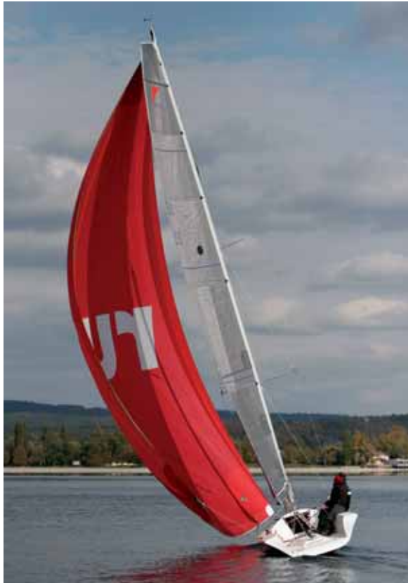
Satte Leistung: Mit dem Toppennaker, 100 Quadratmeter Segelfläche für 900 Kilogramm Bootsgewicht, ist beeindruckend.

Rumpf und Deck sind miteinander verklebt und von innen mit einem Glasgewebe überlaminiert. Unter dem Vordeck wird der Gen-