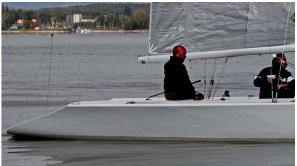
Der Rumpf der Onyx zeichnet sich durch flache, gestreckte Linien aus. Die Segelleistungen sind auf allen Kursen ohne Ta de