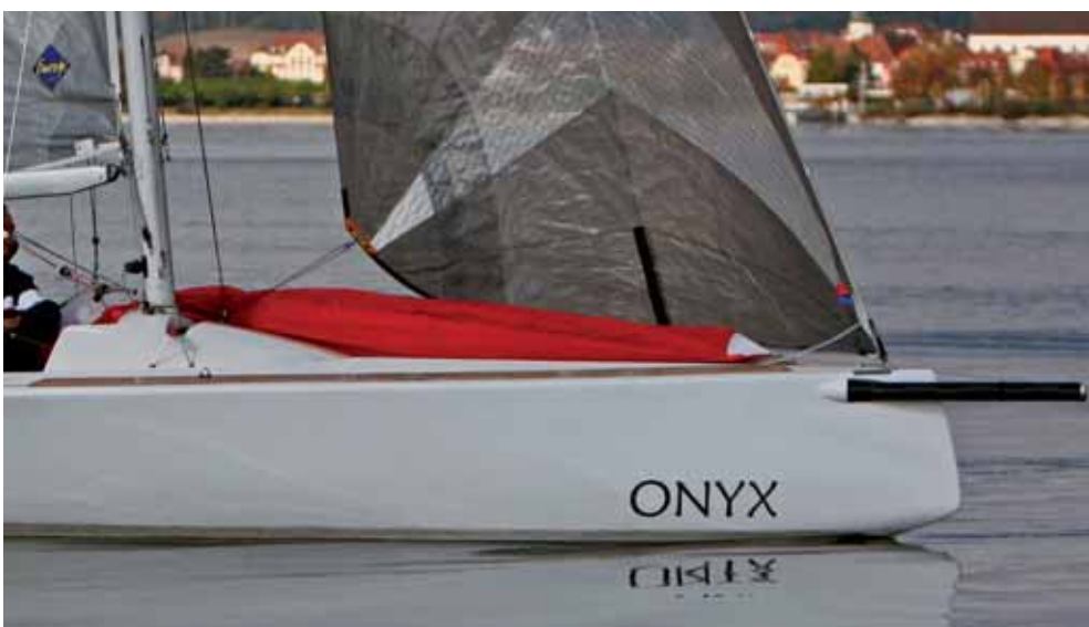
Tadel und das Boot ist jederzeit auch von einer kleinen Mannschaft oder sogar einhand leicht zu beherrschen.

Der Mastfuß ist klappbar und wird um einen stabilen Bolzen gekippt. Somit kann