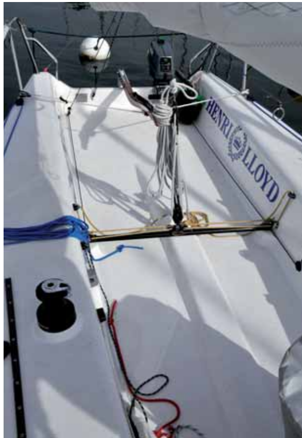
Das einfach aber funktionell und hochwertig ausgestattete Cockpit besticht vor allem durch Geräumigkeit.

Das Rigg aus Aluminium ist mit zwei gepfeilten Salingpaaren ausgerüstet und