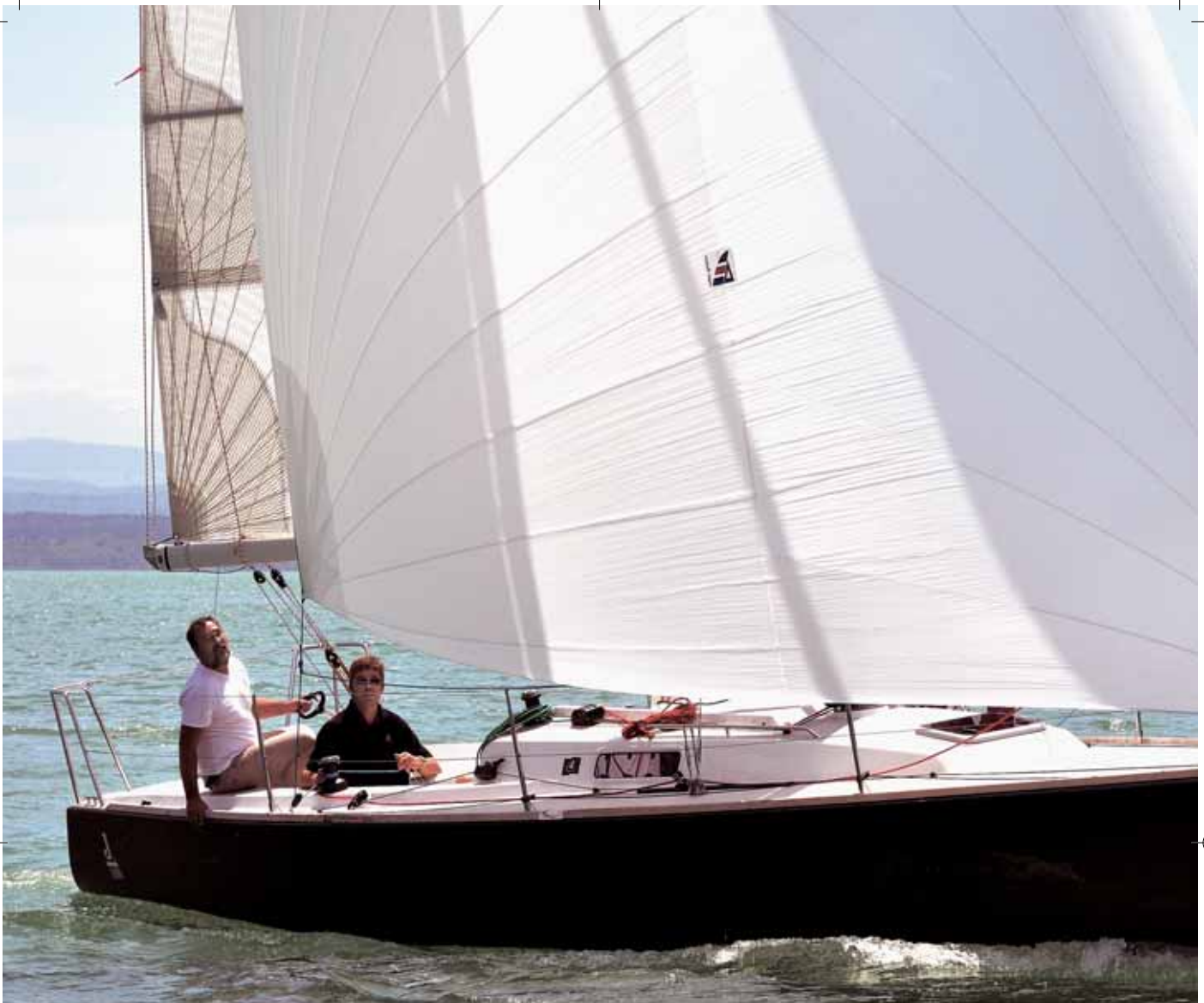
Die J / 100 ist ein Segler, der unwahrscheinlich Spaß macht.