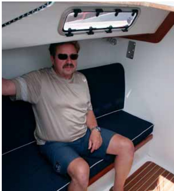
Kein Boot mit Stehhöhe, aber ausreichend Platz zum Sitzen unter Deck, wenn man nicht zu groß ist. Die J / 100 ist kein Wohnboot und der Ausbau unter Deck ist auf das Wesentliche begrenzt.

Von der Kabine aus gut zugänglich ist der Motor, an den man kommt, wenn man zwei Bügelverschlüsse öffnet und den Niedergang wegnimmt. Dort tut ein Volvo D1-13 mit 13 PS / 9 kW seine Arbeit und treibt als Saildrive einen Faltpropeller an.