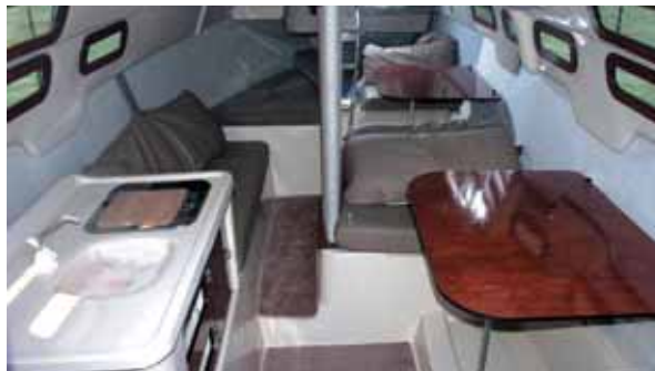
Die Kabine bietet deutlich mehr Platz und ist heller.

stärken mehr und die Mac Gregor kommt auf rund sechs Knoten. Das Boot reagiert sehr willig auf das kleine und für Segler gewöhnungsbedürftige Ruder, wobei sich die Ruderanlage deutlich verbessert gegenüber dem Vorgängermodell zeigt. Wind weg – Motor an, dann kann das Herz des Motorbooters höher schlagen. Zunächst wird das Schwert per Hand leichtgängig hochgezogen, ebenso die Ruderblätter. Dann wird unter Motor der Wasserballasttank gelenzt, indem man mit geöffneten Ventilen losfährt. Nach rund vier Minuten hat es das Wasser herausgesaugt, was sich deutlich im Fahrverhalten bemerkbar macht. Rund 500 Kilogramm