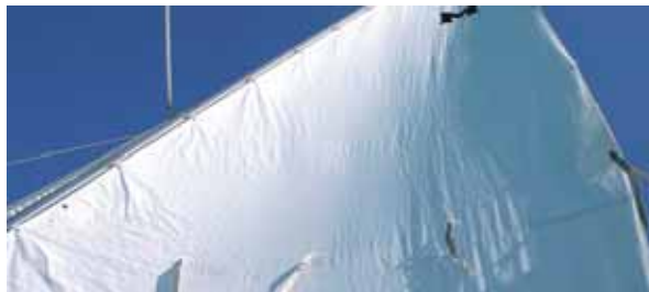
Einfaches Handling, auch beim Reffen.