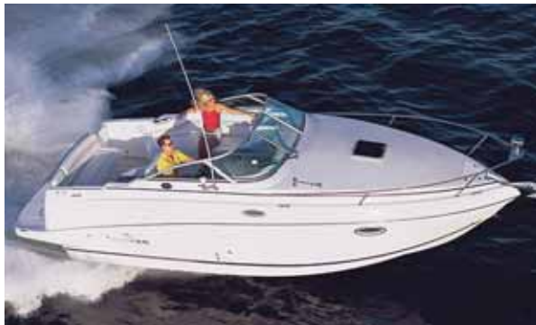
Boote von Rinker mit neuem Antrieb zum Testen.

Die Firma Motorland in Mannheim, Importeur des amerikanischen Herstellers Rinker, veranstaltet gemeinsam mit dem MYC Kurpfalz, in Mannheim eine Testwoche für alle interessierten Motorbootfahrer. Vom 9. bis 17. Juni können alle Rinker-Boote zwischen 19 und 28 Fuß auf dem Rhein bei Mannheim gefahren werden.