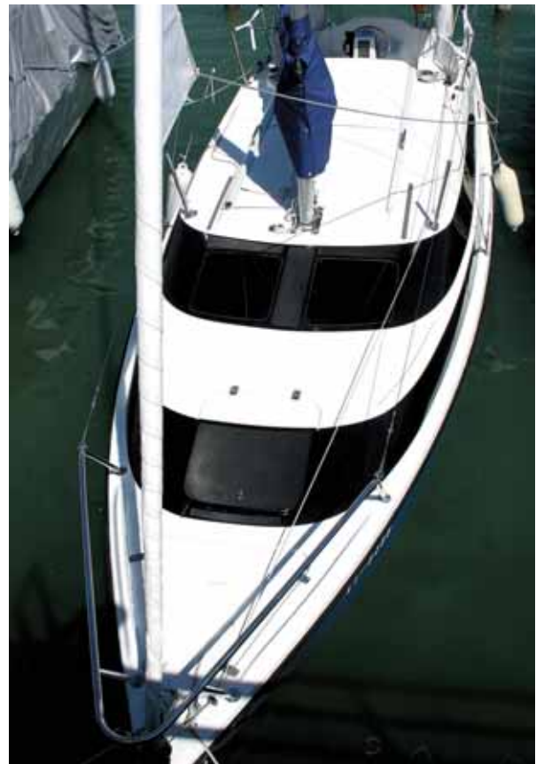
Das Backdeckerprinzip schafft Platz.

Den Segeleigenschaften kommt ein Innenballast mit 136 Kilogramm, ein höheres Rigg und mehr Segelfläche und ein überarbeitetes Unterwasserschiff mit Steck-