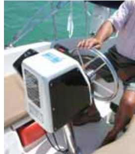
Bewährtes wie der Steuerstand sind geblieben.