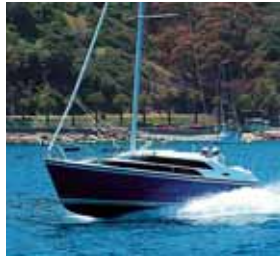
Ist der Wasserballast gelenzt und hängt ein leistungsstarker Außenborder am Spiegel, kommt die Mac Gregor ins Gleiten.

Unser Vorführboot hat eine Genua, die es an diesem Tag auch braucht, um dem jetzt rund 1800 Kilogramm schweren Boot Beine zu machen. Rund zwei Beaufort sind nicht die Lieblingsbedingungen der Mac Gregor 26 M, aber das Boot läuft und das nicht zu schlecht. Sowohl am Wind als auch Raumschots erreichen wir rund 3,5 Knoten und das bei einem Wendewinkel von rund 100 Grad. Zwei Wind-