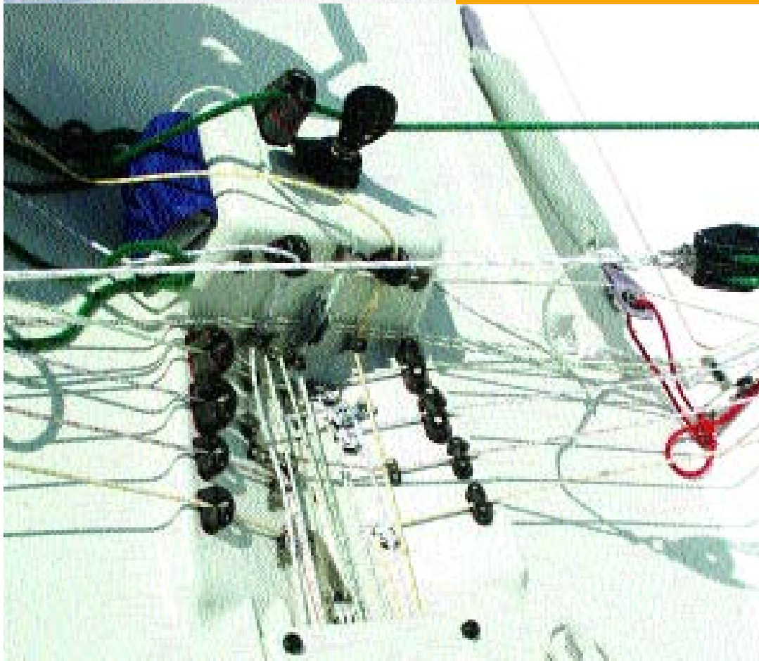
Unten rechts: der Mastfuß. Alles was hier an Leinen ankommt, wird am Kiel vorbei und durch einen Kanal zum Steuermann geführt.