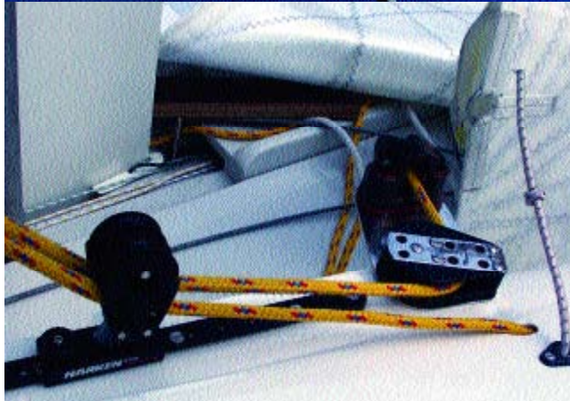
Mitte links: Die Fockschot ist doppelt geführt. Ein Part verschwindet unter Deck und hängt an einer Talje, die vom Steuermann verstellbar ist. Die Ratschblöcke sind allerdings seitenverkehrt montiert.