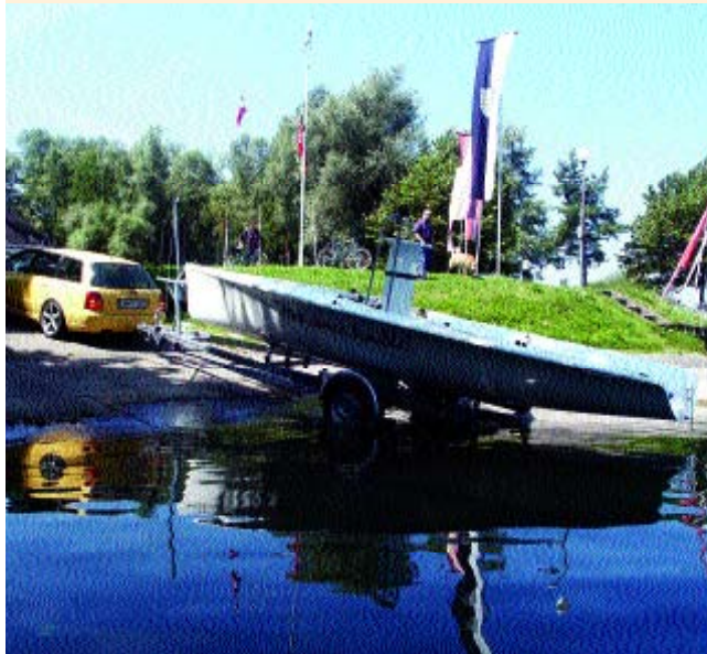
Oben links: Wozu Liegeplatz? Slippen ist kein Problem.

Fazit: Eine solide und ausgewogene Konstruktion wurde hier hervorragend umgesetzt. Das Boot segelt einfach toll, ohne dass es überfordert. Man muss weder Bodybuilder noch Schlangemensch sein, um damit seinen Spaß zu haben. Jollenerfahrung ist zwar hilfreich, aber nicht unbedingt Voraussetzung. Die Liegeplatzfrage steht auch nicht unbedingt im Vordergrund. Ein halber Meter Wassertiefe an einer Sliprampe reicht aus, um die Streamline ihrem Element zu übergeben. 28 100,- Euro kostet der Spaß. Nackt. Dazu kommt ein Satz Segel für etwa 4500,- Euro und der Trailer ab 3150,- Euro. Bei einem Sandwichrumpf sind die optionalen Breitaufgaben für 600,- Euro zu empfehlen. Dazu kommen Ober- und Unterpennung sowie eine Rudertasche für 1475,- Euro. Das macht 37 825,- Euro für das komplette Boot. Der Gegenwert ist ein stabiles und langlebiges Sportgerät, das durchdacht ist und hervorragend segelt. Und zwar so, wie es von der Werft geliefert wird. Das findet man selten. Wenn sich die Streamline als Klasse durchsetzen kann, dürfte ein hoher Werterhalt gegeben sein. Davor muss der neue Gebietshändler aber noch kräftig die Werbetrommel rühren. Es ist nicht einfach, einen „Bodensee-Salzbuckel“ hinter seinem Kartenplotter hervorzulocken und ihn für ein solches Vergnügen zu begeistern. mh