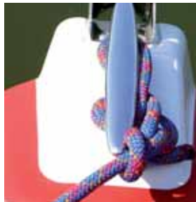
In den Bug eingearbeitete Klampe.