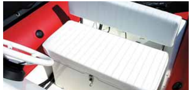
Gut gepolsterte Sitzbank mit Rückenlehne für zwei Personen.

gewähren. Und was auch nicht unerwähnt bleiben soll: bei Zodiac kann sich jeder Eigner nach persönlichen Vorstellungen „sein“ Boot zusammenstellen. Wer auf die Steuerstandkonsole aus Platzgründen – wie zum Beispiel Taucher – verzichten möchte, der fährt eben auf dem Tragschlauch sitzend, kann den vollen Innenraum ausnutzen, muss dann eben über die Pinne steuern. Als sportliches Familienboot hingegen würden wir allerdings in jedem Fall zur Ruderanlage raten, allein schon aus Sicherheitsgründen bei stärkerer Motorisierung.