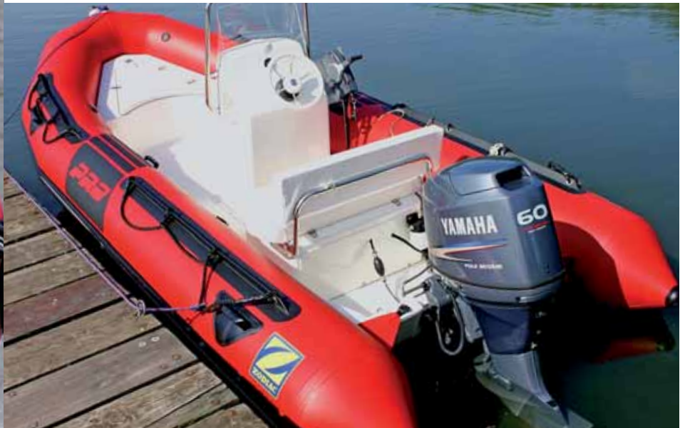
Zugelassen für immerhin neun Personen – daher auch die Typisierung „9 Man“ – die sich auf den Sitzflächen und Schläuchen verteilen.