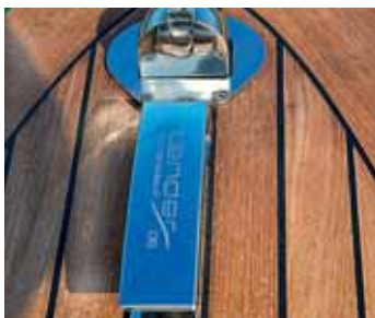
Formschön: Klampe und Buglicht.