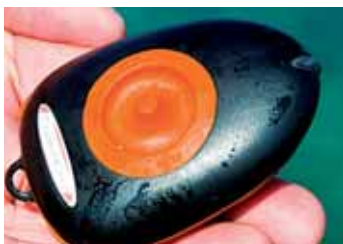
Start- und Abschaltautomatik trägt man zur Sicherheit am „Mann“.