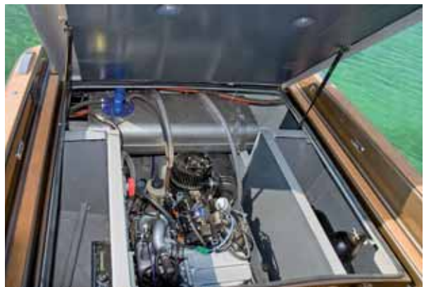
Der Weber-Motor ist ein Leichtgewicht mit hoher Leistung.