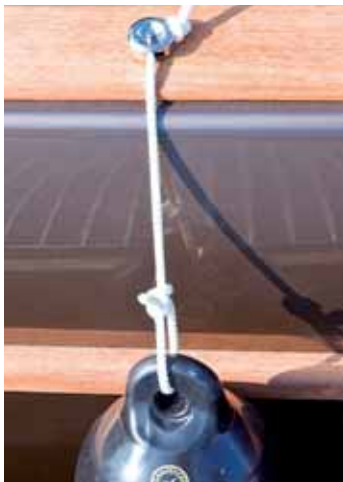
Stecken statt Knoten.

Im Hinblick auf das Wohlgefühl der Crew kann man ihn aber auch ganz gesetzt fahren und das mit einer Reihe von Vorteilen gegenüber jedem Schraubenan-