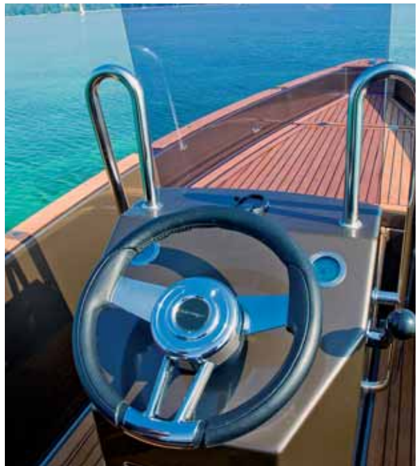
Die sparsame Instrumentierung wurde dem Design angepasst.