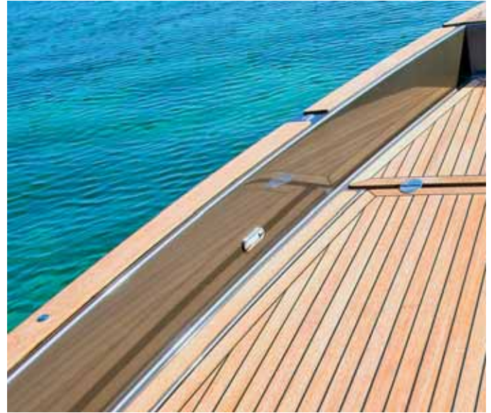
Teakholz und hochwertige Verarbeitung zeichnen den Tender aus.

Ganz anders ist das Kurvenverhalten in schneller Fahrt. Mit dem Leichtgewicht tut man gut daran, das vorsichtig anzugehen. Aus gutem Grund macht die Werft mit jedem Kunden zunächst ein paar Probefahrten, um ihn auf das Fahrverhalten eines Jetantriebs aufmerksam zu machen. In engen Kurven muss man nämlich ähnlich wie im Flugzeug gegensteuern, ganz im Gegensatz zum Schraubenantrieb.