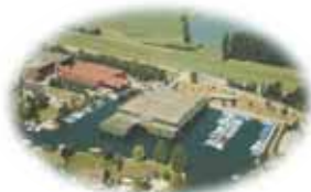
Zweigbetrieb Seedamm-Marina Pfäffikon/SZ