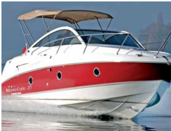
Vorbereitet: das Rumpfloch für den Bugstrahler.

netzte Fläche reduzieren, was sich in weniger Verbrauch, besserer Beschleunigung und höherer Geschwindigkeit niederschlagen soll. Die Theorie lässt sich in der Realität kaum überprüfen, was man aber sagen kann ist, dass die Monte Carlo 27 in der Praxis ein Boot ist, das durch ein ausgeprägt gutes und vor allem frühes Gleitverhalten auffällt. Beim Übergang von der Verdränger- in die Gleitfahrt streckt die Französin die Nase etwas weit hoch, neigt sie dann wieder sanft, wenn sie bei rund 3300 U/min und 20 Knoten zu gleiten beginnt. 3500 U/min und 21 Knoten bedeuten volle Gleitfahrt, und hat man sie erreicht, kann man mit gefühlvollem Nachtrimmen des Z-Antriebes das Gas wieder etwas zurücknehmen. Das spricht für die Theorie, denn im Gegensatz zu vielen anderen Booten fällt die Monte Carlo 27 nicht sofort in ein Loch und zurück in die Verdrängerfahrt.