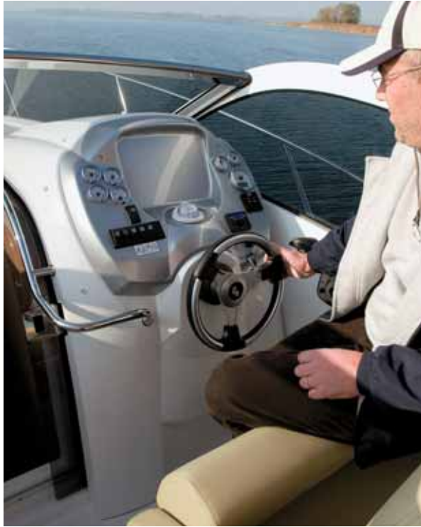
Grundinstrumentierung von Volvo und viel Platz für einen Plotter oder PC.