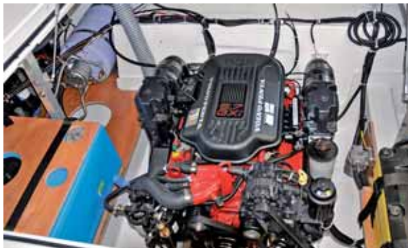
Passt gut zum Boot: der Volvo Penta 5,7 GXi.