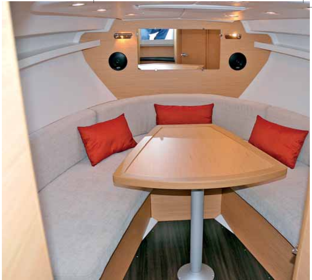
Hell und freundlich wirkt der Salon, der in Eiche hell ausgebaut wird. Bei den Polstern kann man unter vier Farben wählen.

Die brandneue Monte Carlo 27 ist das einzige einmotorige Modell in der ansonsten mit Doppelmotorisierung bestückten Monte-Carlo-Reihe und im wahr-