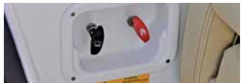
Schalter für Benzinhahn und Feuerlöscher.