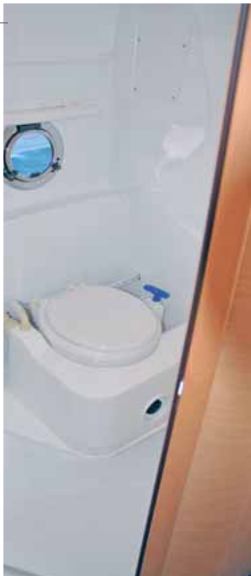
vor der Toilette. Das Grauwasser wird separat

ten Sinn des Wortes der Einstieg in die neue Bénéteau-Serie: Sie ist mit 8,54 Metern Länge nicht nur das kleinste Modell, sondern mit einer einfachen und zweckmäßigen Grundausstattung auch das erschwinglichste. Also sozusagen mediterranes Powerbootflair für Otto Normalverbraucher, denn der wird wie jeder bei Mittelmeer zunächst an hohe Preise und dann aber an Jet-set denken... und die Monte Carlo 27 ist der Einstieg in diese Welt.