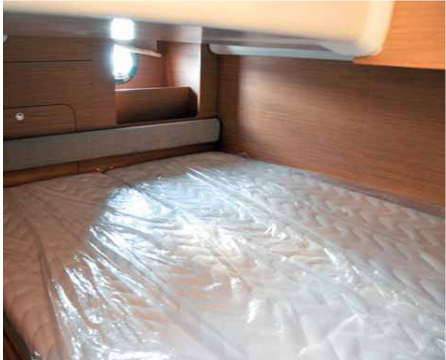
Einladend und bequem ist die Achterkabine.