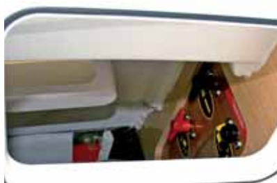
Batterie Hauptschalter sind leicht zugänglich.