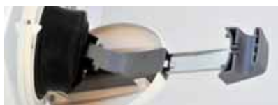
Handlenzpumpe im Cockpit.