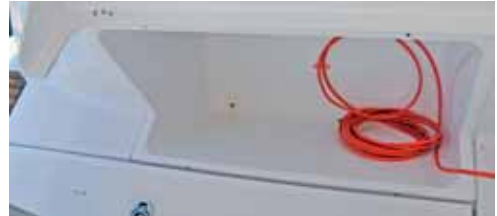
Stauraum für die Rettungsinsel. Am Bodensee kann man ihn für Leinen und Fender nutzen.