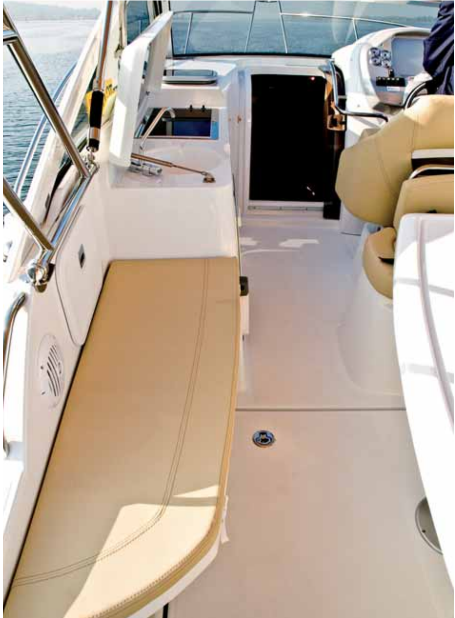
Ein gut gestaltetes Cockpit. Hinter der seitlichen Luke sind die Hauptschalter.

Die Motorisierung stammt von Volvo. Künftige Eigner haben die Wahl zwischen dem Volvo Penta D 4-225 DP mit 165 kW / 225 PS, einem Diesel, der die BSO-Stufe II erfüllt und dem D4-260 DP (191 kW / 260 PS). Unsere Monte Carlo 27 war mit dem Volvo Penta 5.7 GXi / DP V 8 mit 235 kW / 320 PS motorisiert, einem Benziner, der für den Bodensee mit Katalysator bestückt werden muss, um die Abgasvorschriften zu erfüllen. Dieser Motor harmonisiert hervorragend mit dem Rumpf und der weist eine Besonderheit auf, die Bénéteau Air Step nennt: Während die vordere Hälfte des Rumpfes dem Unterwasserschiff mit einem tiefen V für Rauwassereinsatz entspricht, wurde in der zweiten Hälfte eine V-förmige Stufe eingeformt. Durch zwei Rohre wird oberhalb der Wasserlinie Luft in den Unterwasserbereich hinter der Stufe gesaugt, so dass das Boot bei hohen Geschwindigkeiten auf einer Art „Luftkissen“ fährt. Aufkimmungen seitlich achtern und ein weit in den Rumpf gezogener Antrieb verhindern, dass die Luft entweicht. Dieser konstruktive Trick soll im Prinzip die be-