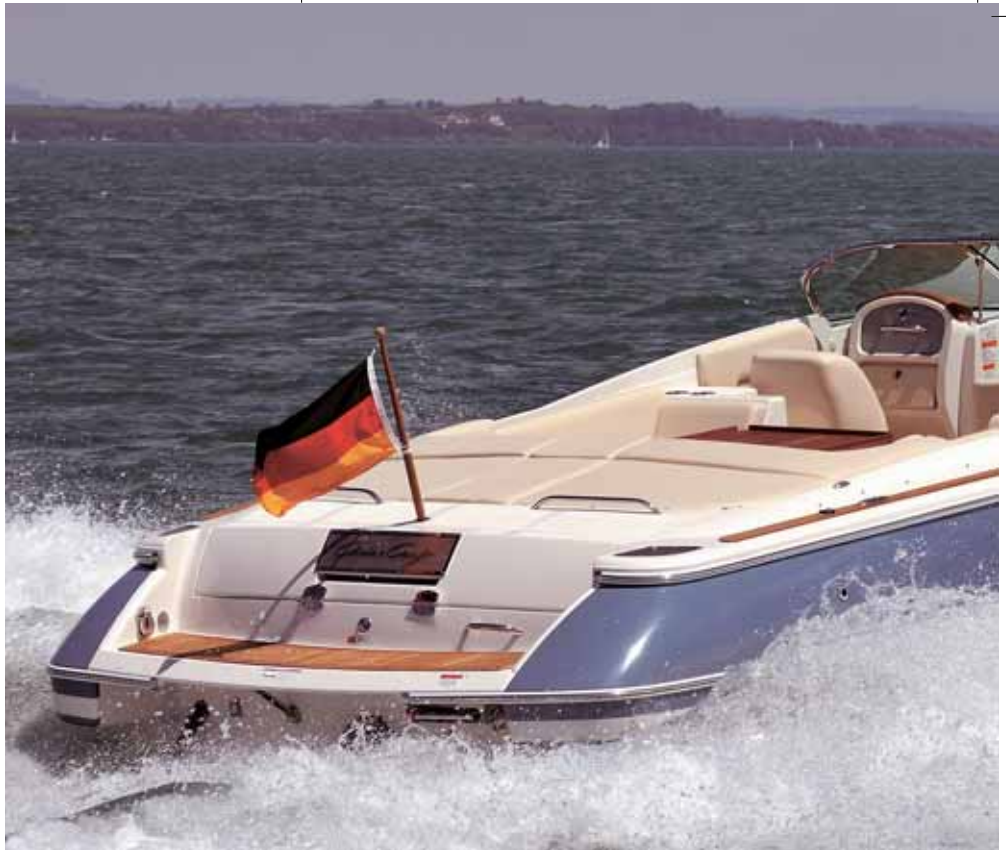
Flach und breit liegt die Corsair stabil auf dem Wasser.

Der Motorraum ist über eine große Klappe zugänglich, die sich mit zwei Zylindern per Knopfdruck elektrisch öffnen lässt. Die technische Ausrüstung macht einen sauberen Eindruck und die Zugänglichkeit ist hervorragend, egal ob das die beiden Batterien oder die Feuerlöschanlage sind. Kabel und Leitungen sind sauber verlegt, fast alle in speziellen Kabelsträngen. Die Corsair 28 ist eines der ganz wenigen vieler Boote, die wir