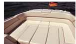
Keile für die Liegefläche.