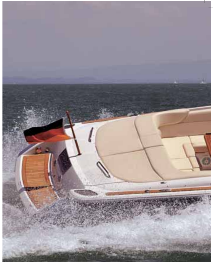
Leistungssportler auf dem Wasser.

Drückt man den Gashebel nach vorn, fängt der Duo-