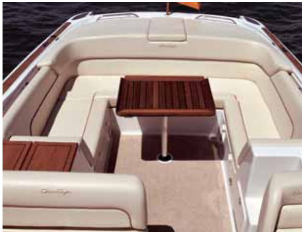
Ein formschönes Cockpit mit edler Polsterung.