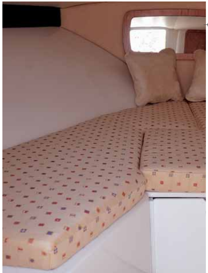
Großzügig, aber wenig Höhe und Stauraum.