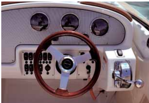
Instrumente: Klassisches Aussehen mit moderner Technik.