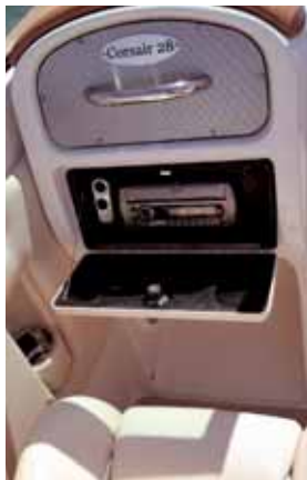
Beifahrersitz und Stereoanlage.