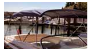
Das Verdeck wird unter der Motorhaube verstaut.