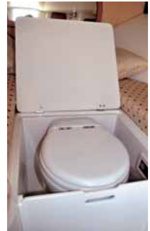
WC unter der Koje.