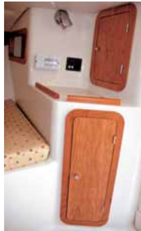
Stauraum und Elektronikzugang.