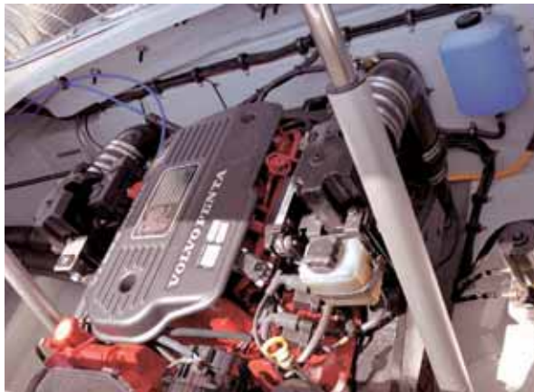
Saubere Installation im Motorraum.