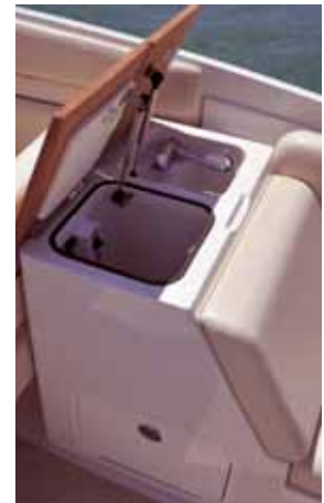
Wetbar mit Teakabdeckung.