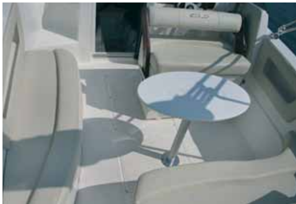
Zu sechst lässt sich das Cockpit gut nutzen.

tank ist vorhanden, ein Schmutzwassertank muss noch nachgerüstet werden. Ein kleiner Kocher findet hier ebenfalls Platz. Stauraum findet man unter allen drei Sitzbänken.