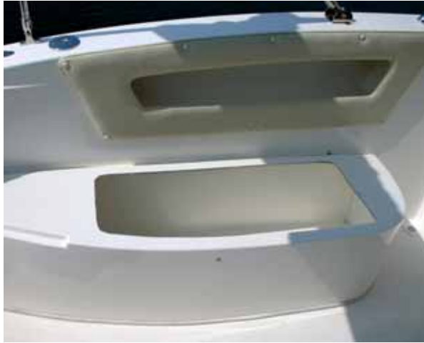
Unter jeder Sitzbank ist Stauraum, der reichlich vorhanden ist.