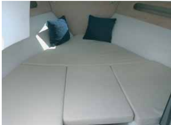
Die kleine Kabine hat eine große Liegefläche.

meerverhältnissen entspricht, hartgesottene Nehmerqualitäten ab. Laut Bodenseevertreter Roland Rieger von der Phönix-Boots-Börse ist aber ohnehin eine Überarbeitung der Frontscheibe in Arbeit. Der Fahrerstand ist mit allem notwendigen ausgestattet. Eine gute Idee ist die Ablage oberhalb des Steuerrads mit der Plexiglas-Abdeckung, wo man Handy, Schlüssel oder Brieftasche ablegen kann. Das Boot wird vor allem im Stehen gefahren, da es keine Fußstütze für die Sitzposition gibt.