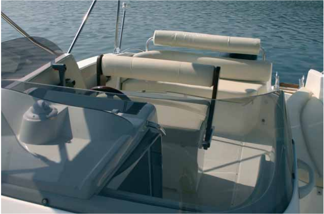
Das Cockpit bietet reichlich Sitzplätze. Die Lehne der Fahrerbank kann nach vorne geklappt werden, sodass man auch hier nach achtern sitzen kann.

meerverhältnissen entspricht, hartgesottene Nehmerqualitäten ab. Laut Bodenseevertreter Roland Rieger von der Phönix-Boots-Börse ist aber ohnehin eine Überarbeitung der Frontscheibe in Arbeit. Der Fahrerstand ist mit allem notwendigen ausgestattet. Eine gute Idee ist die Ablage oberhalb des Steuerrads mit der Plexiglas-Abdeckung, wo man Handy, Schlüssel oder Brieftasche ablegen kann. Das Boot wird vor allem im Stehen gefahren, da es keine Fußstütze für die Sitzposition gibt.