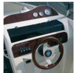
Einfach ausgestattet: Der Steuerstand.