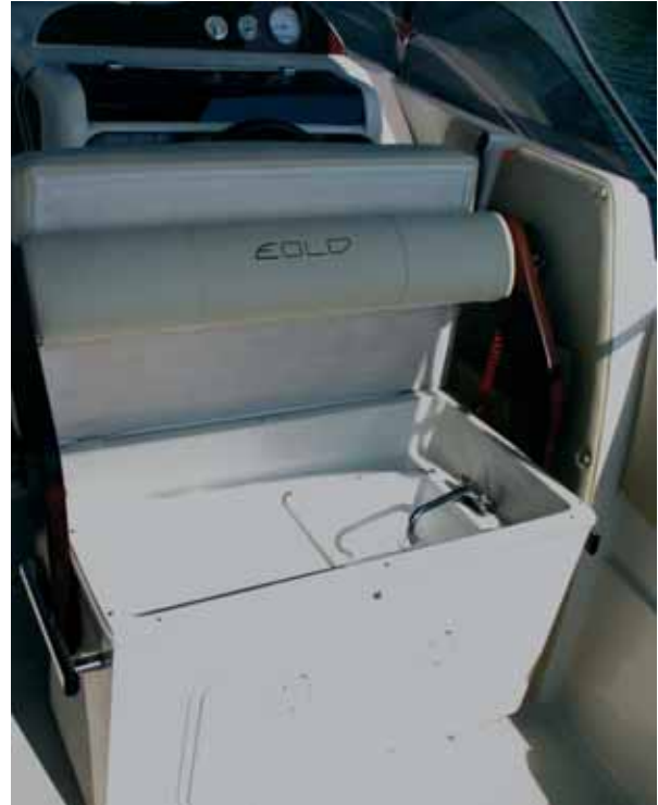
Unter der Fahrersitzbank ist eine Spüle eingebaut.

Die Verarbeitung ist im Großen und Ganzen gut. Saubere Laminierung und einwandfreies Gelcoat sprechen für solide Handarbeit. Innen ist der Rumpf mit Topcoat versiegelt, wie man sich das standardmäßig wünscht. Trotzdem leistet sich die Werft ein paar kleine Schwachpunkte, die nicht sein müssen und nichts anderes als unnötige Nachlässigkeit sind. So standen im Ankerkasten zum Beispiel Glasfasern vor. Das ist einfach unschön und sollte von der Werft noch ausgemerzt werden. Ordentlich sind auch die Edelstahlbeschläge.