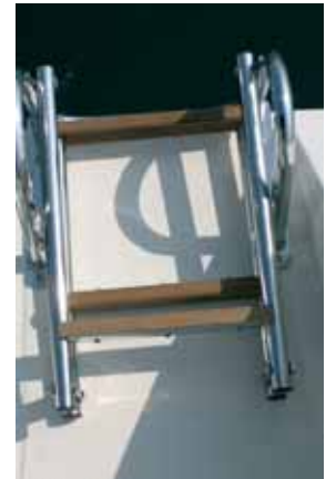
Einfach aber zweckmäßig.